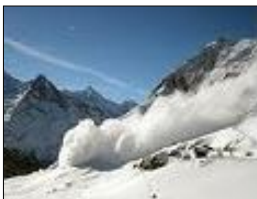
හිමකඳු කඩා වැටීම්