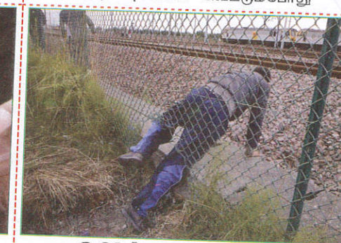
பாதையில் When crossing the fence வேலிகளில் பூந்து செல்லும்போது