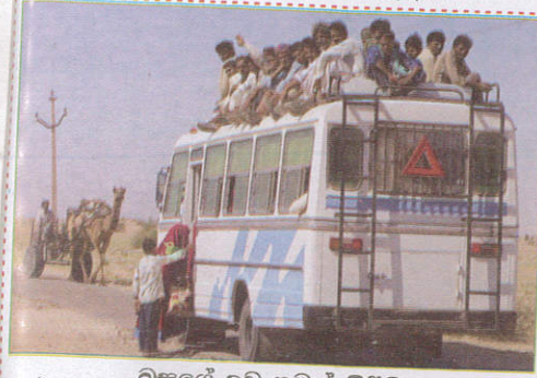
பாதையில் Traveling on top of the bus பேருந்தியின் மேலே பயணித்தல்