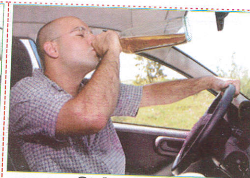
பெரிசெல்லி Drinking alcohol while driving மது அருந்துதல்