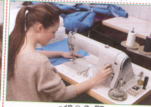
பாதையில் When stitching தைக்கும்போது