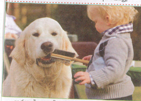
பாதையில் When playing with pets செல்லப்பிராணிகளுடன் விளையாடும்போது