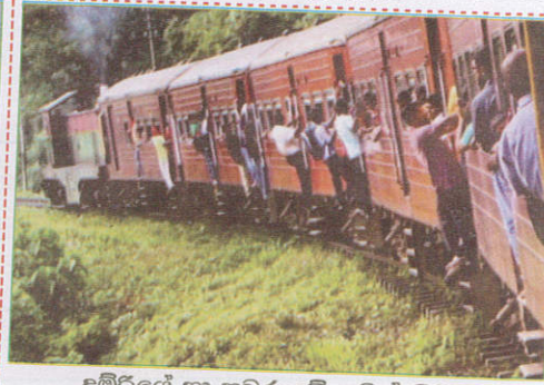
பாதையில் Traveling on the footboard of train புகையிரத மிதிப்பலகையில் பயணித்தல்