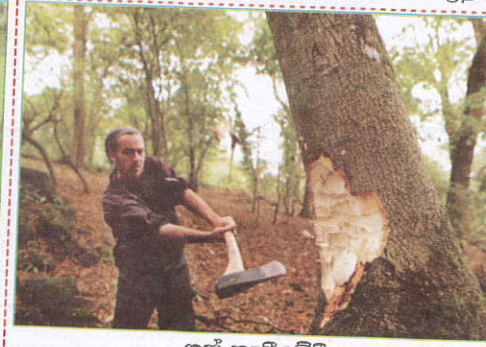
பாதையில் When cutting trees மரங்களை வெட்டும் போது