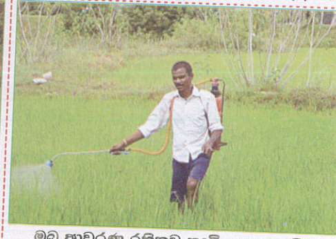
பாதையில் Applying weedicides without using face cover முகமூடி அணியாமல் மருந்து உபயோகித்தல்