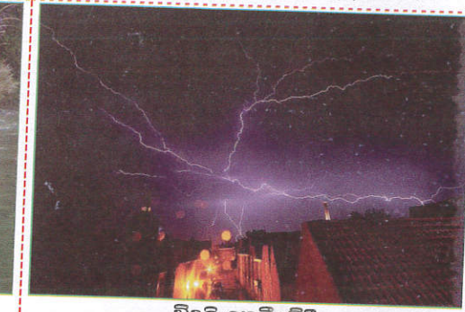
பாதையில் Lightning மின்னல் வெட்டுதல்