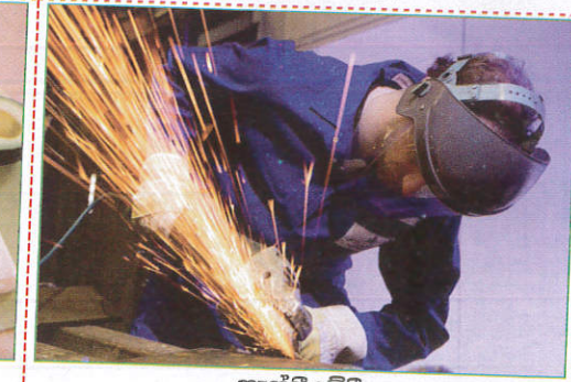
பாதையில் When welding வேல்டிங் செய்யும்போது