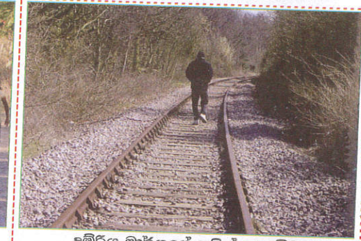
பாதையில் Walking on the railway ரயில் பாதையில் நடத்தல்