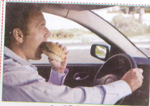
சாப்பிட்டுக்கொண்டு Eating while driving உணவு அருந்துதல்