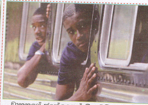
பாதையில் Putting the head out of the vehicle வாகனத்திற்கு வெளியே தலையை போடுதல்