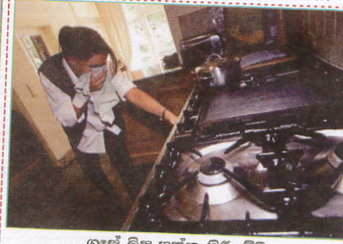
பாதையில் Switching on the gas cooker எரிவாயு அடுப்பை பற்றவைக்கும்போது