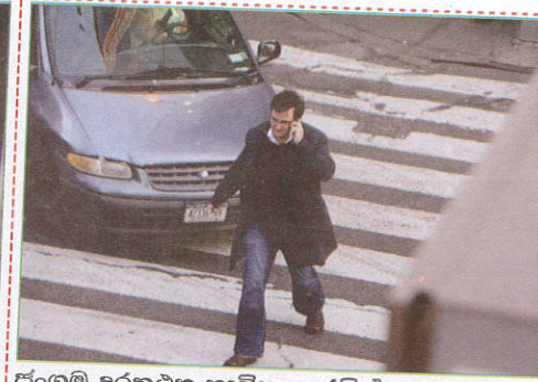
பாதையில் Calling while crossing the road பாதையை கடக்கும் போது தொலைபேசியில் உரையாடுதல்