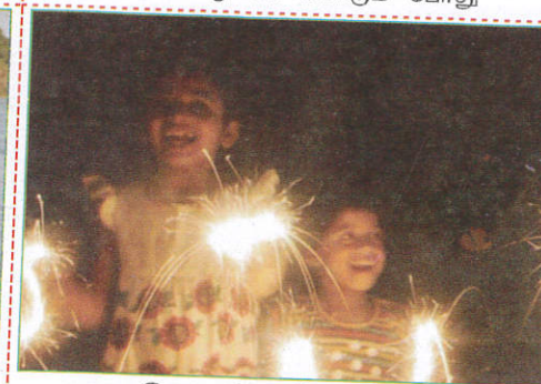
பாதையில் When playing with fire works மத்தாப்பு பற்றவைக்கும்போது