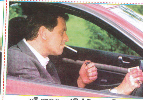
புகைப்பிடிக்க Smoking while driving புகைத்தல்