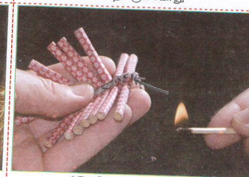
பாதையில் When playing with crackers பட்டாசு வெடிக்கும்போது