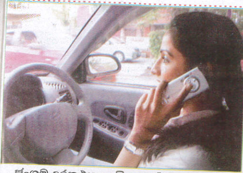
செல்பேசி பேசும்படி Calling while driving தொலைபேசியில் கதைத்தல்