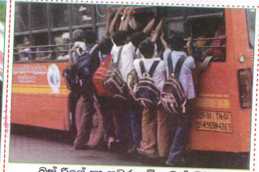
பாதையில் Traveling on footboard மிதிப்பலகையில் பயணித்தல்