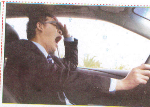
சுயேச்சையாக Sleeping while driving உறங்குதல்