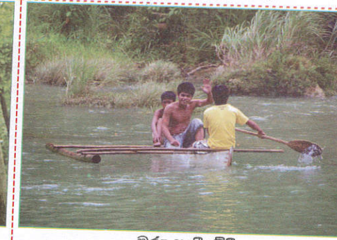
பாதையில் Boat riding ஓட்டத்தில் பயணித்தல்