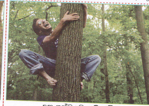
பாதையில் Climbing huge trees உயரமான மரங்களில் ஏறுதல்