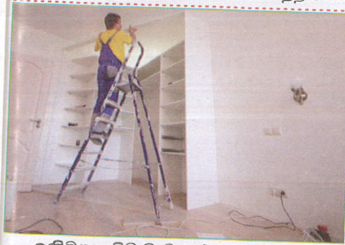
பாதையில் When working on the ladder ஏணியில் வேலை செய்யும்போது