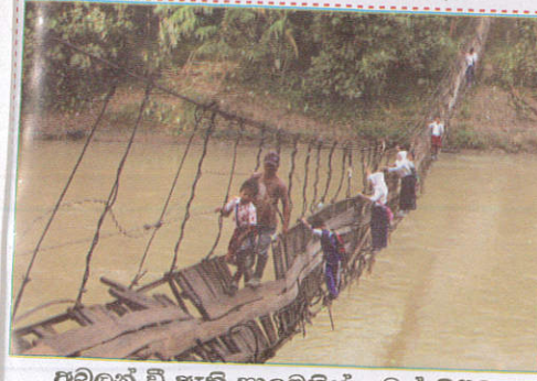
பாதையில் Walking through damaged bridges உடைந்த பாலங்களில் பயணித்தல்