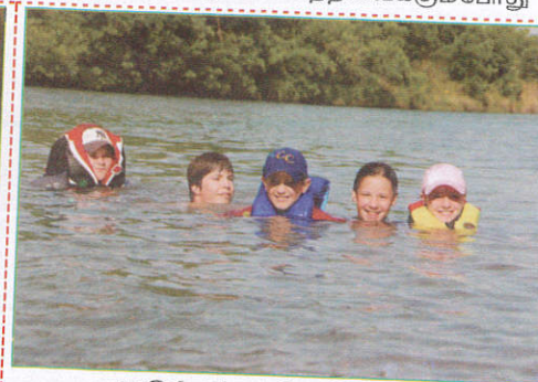
பாதையில் When swimming நீந்தும் போது