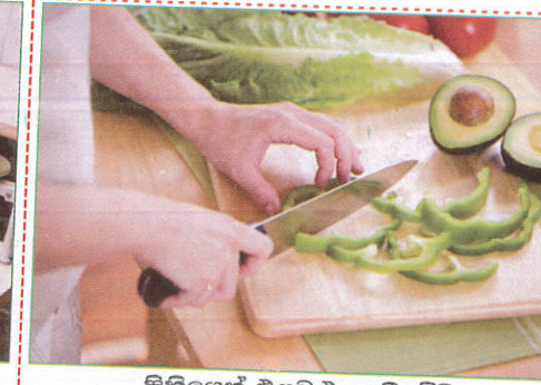
பாதையில் When cutting vegetables மரக்கறிகளை வெட்டும்போது