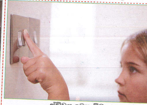
பாதையில் When on the switch மின்னாழியை போடும் போது