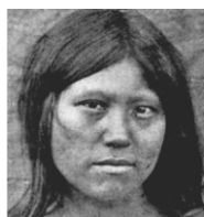
මොන්ගොලොයිඩ් (ල. 4)

ii. පහත සඳහන් වන්නේ ජලයේ බිහි වූ ජීවීන් ගොඩබිමේදී විවිධ සතුන් ලෙස වර්ධනය වූ ආකාරයයි. එම සත්ව වර්ග අදාළ පිත්තූර වලට ගැලපෙන පරිදි යා කරන්න.