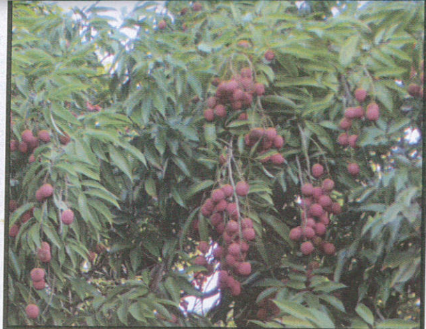
ප්‍රභාසංස්ලේෂණයට Photosynthesis தாவர உற்பத்திகளுக்கு