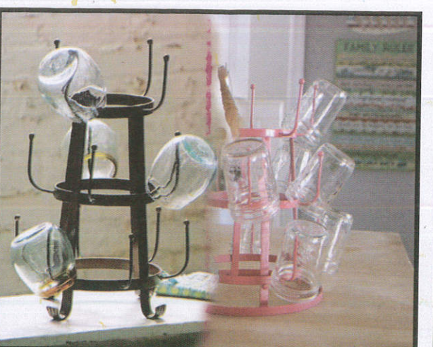
පරිහරණය කරන භාණ්ඩවල විෂබීජ හා කුඩා සතුන් මර්දනය සඳහා to kill the germs and small insects. பாவிக்கும் பொருட்களின் கிருமி மற்றும் பூச்சிகளை அழிப்பதற்கு