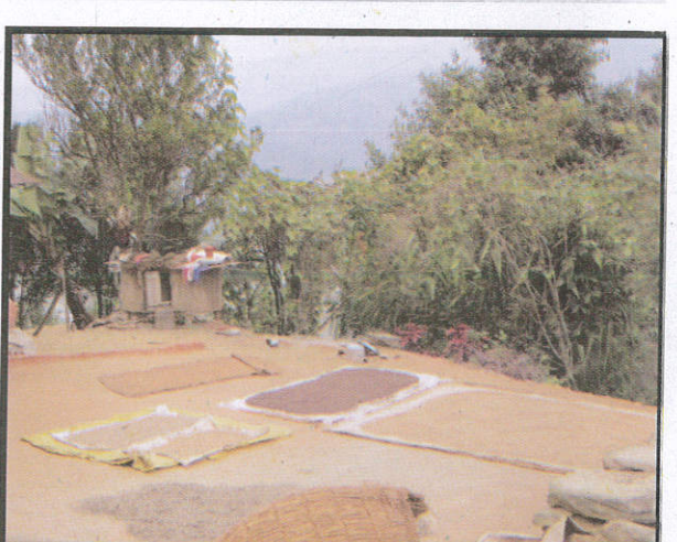
වී ඇතුළු ධාන්‍ය වර්ග විසළා ගැනීමට For drying paddy and other cereals நெல் மற்றும் தானியங்களை உலர்த்துவதற்கு