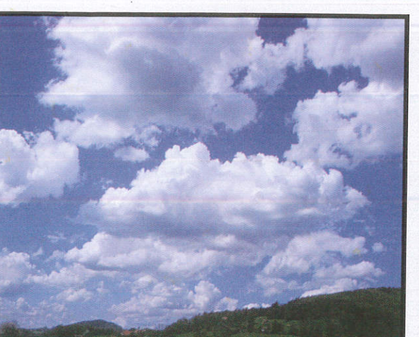
පොළොවේ ඇති ජලය වාෂ්ප වී වළාකුළු සෑදීම මගින් වර්ෂාව ලබාගැනීම සඳහා To receiving rain மழை பெறுவதற்கு