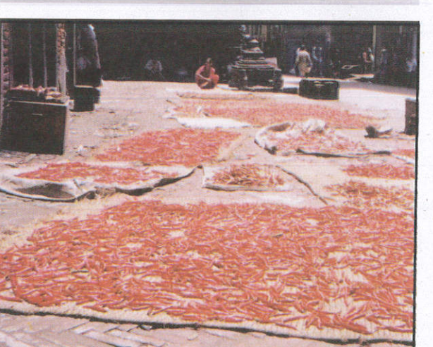
මිරිස් වේලාගැනීමට For drying chillies மிளகாய்களை உலர்த்துவதற்கு