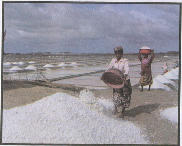
ලුණු ලේවායන් සඳහා To product salt உப்பு தயாரிப்பு