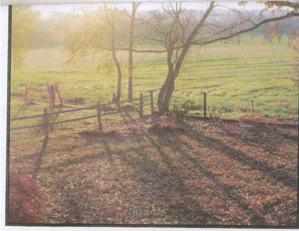
අදුර නැතිකර ආලෝකය ලබාදීම Without darkness give us light இருளை நீக்கி ஒளியை வழங்கல்