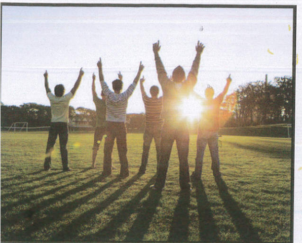
උදෑසන තිරු එළිය අපට විටමින් D ලබාදීම The early morning sun give us vitamin D அதிகாலையின் சூரிய ஒளி எமக்கு விற்றறமின் D யைவழங்குகின்றது