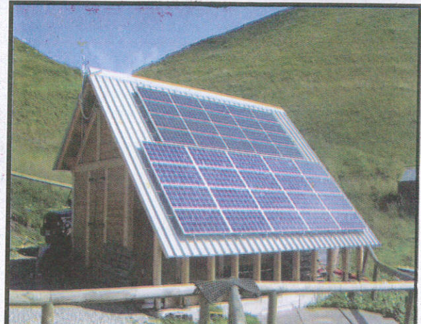
සූර්ය ජනල සඳහා To solar power functions சூரிய சக்தி பணிகள் செய்ய