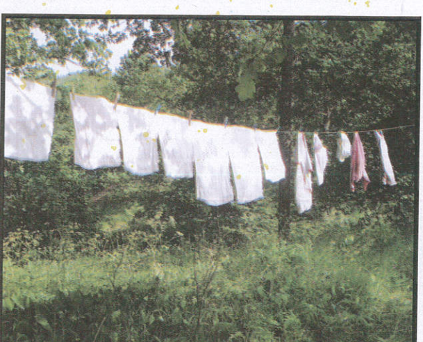
රෙදි විසළාගැනීමට For drying clothes ஆடைகள் உலர்த்துவதற்கு