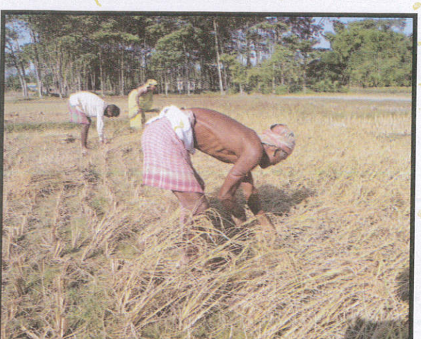
ගොවිතැන් කටයුතු සඳහා For cultivation விவசாய நடவடிக்கைகளுக்கு