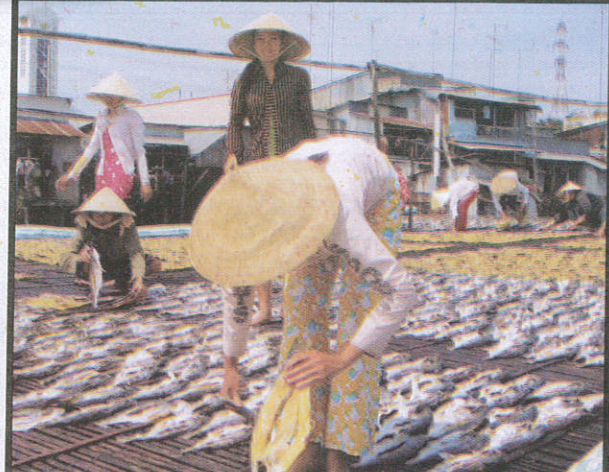
කරවල විසළීම සඳහා For drying fish மீன் உலரவைப்பதற்கு