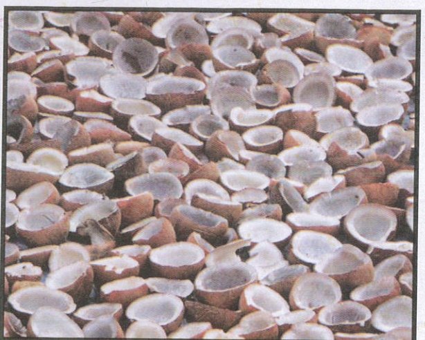
කොප්පරා නිෂ්පාදනය සඳහා For product coppara தேங்காய கொப்பரா தயாரிப்பதற்கு