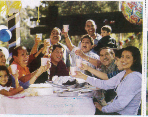
வடூயே / Relatives உறவினர்கள்