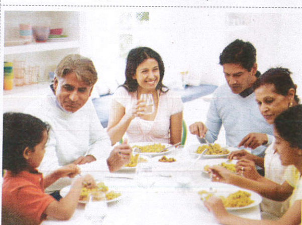
அகலீவாசீன் / Neighbours அயல்வீட்டார்