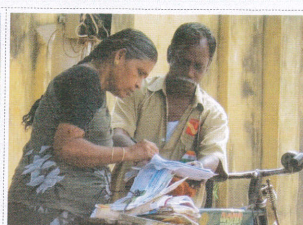
டீஸூமி வெலேஜ / Post Man தபாற்காரர்