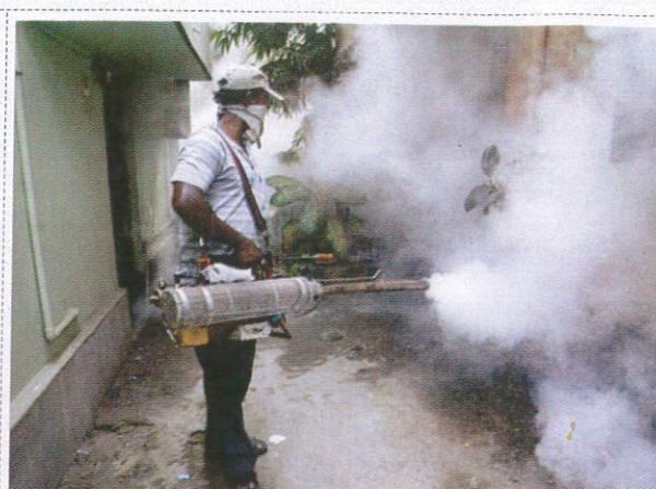
மடூர் மர்மன கிடூர் / Mosquito Repellent Officer நுளம்பு ஒழிப்பு அதிகாரி