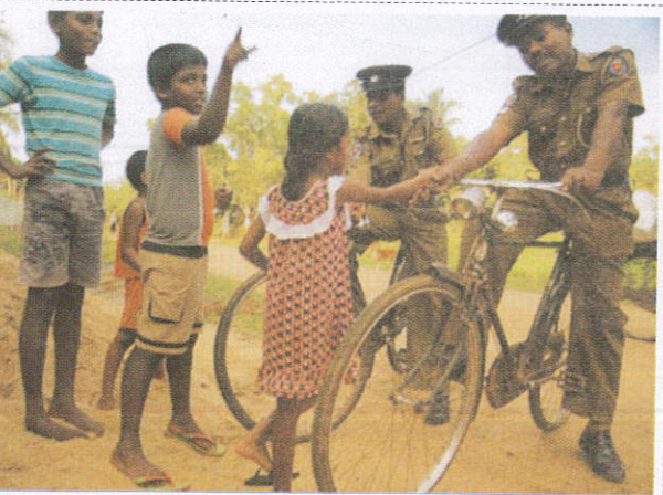
பாலீக் கிடூர்ய / Police Constable பொலீஸ்காரர்