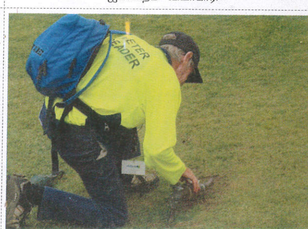
சல மனூ கிடீவனா / Water Meter Reader நீர்மானி வாசிப்பாளர்