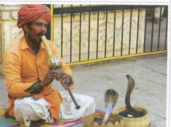
அகிஜூபீகய (அகி வலிவனா) / Gipsy Man பாம்பாட்டி