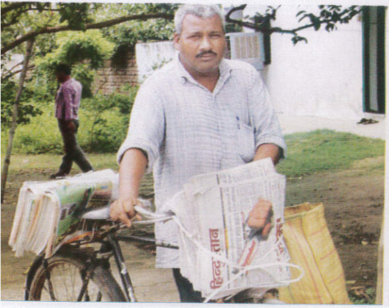
பன்வர வேலேஜ / News Paper Seller பத்திரிகை வியாபாரி