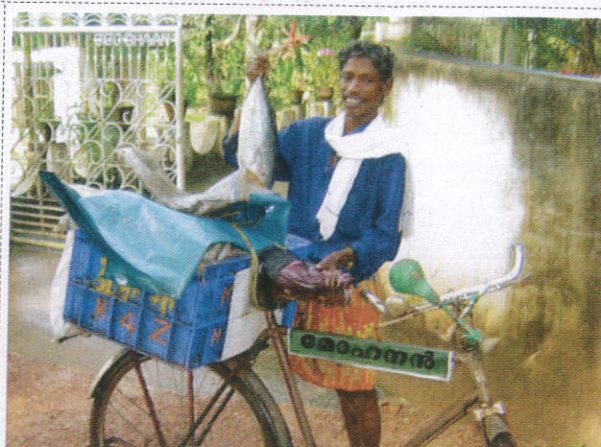
மாலி வேலேஜ / Fish Monger மீன் வியாபாரி