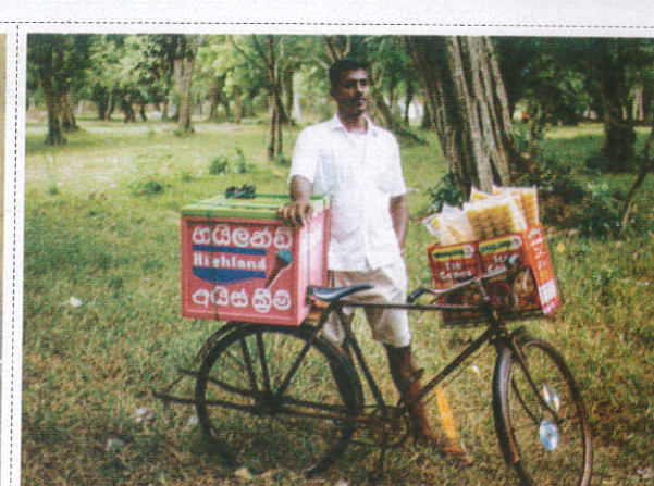
அடிக்விதி வேலேஜ / Ice Cream Seller ஐஸ்கிரீம் வியாபாரி