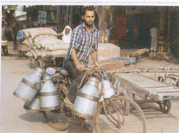
கீர் கெனேஜ / Milk Man பால்காரன்