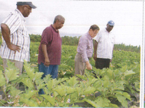
லொ கிடூர் / Plantation Agricultural Officer லிவசாய உத்தியேகத்தர்