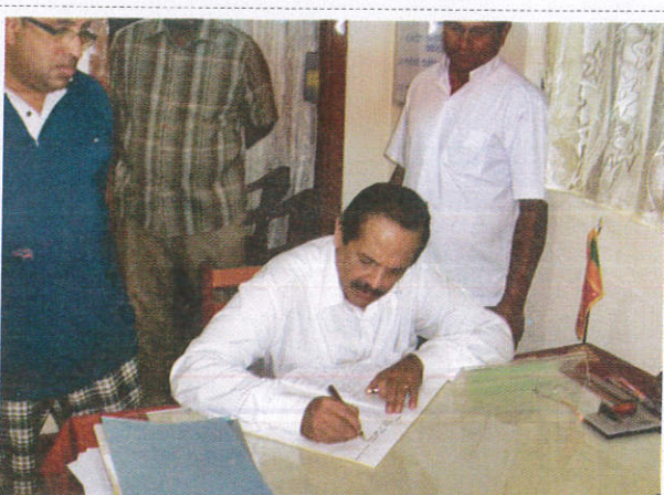
கிராமசேவக / Gramasewaka கிராம சேவகர்