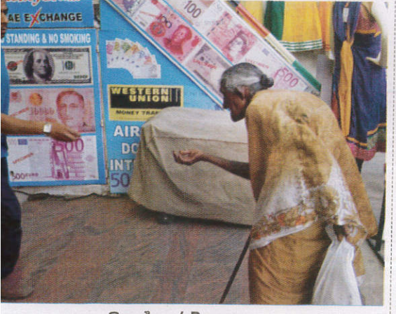
கினேஜ / Beggar பிச்சைக்காரன்