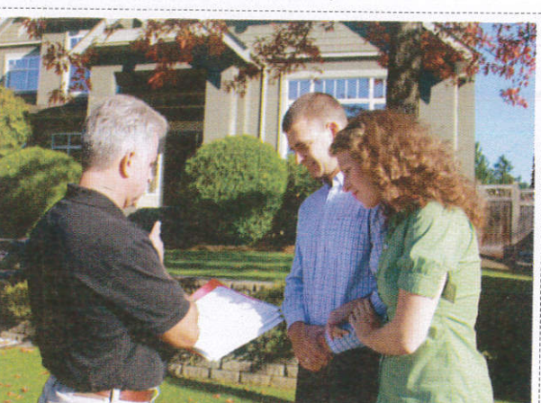
அடார பகனூ கர்னனா / Donation Collector நிதி சேரிப்பாளர்