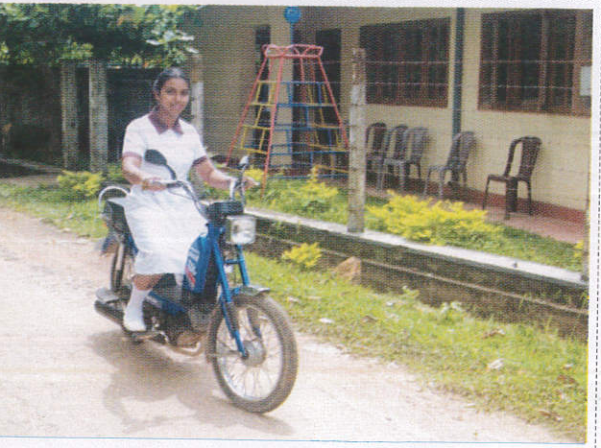
பலிர் சூவெச டீவீகாவ / Mid Wife மருத்துவிச்சி