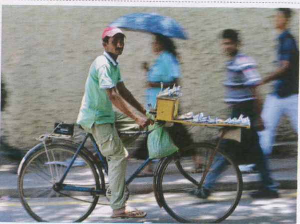
டீஜூமி அடீஜிவி பிவீபன் அலேபீகர்னா / Lottery Seller லொத்தர் வியாபாரி