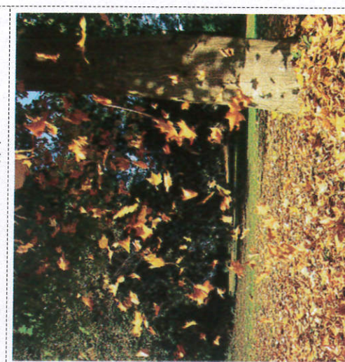
சூலடு வீடிலீ ஂலுலு வீடிலீ Dried leaves falling due to the wind காய்ந்த இலைகள் காற்றினால் பரம்பல் அடைதல்