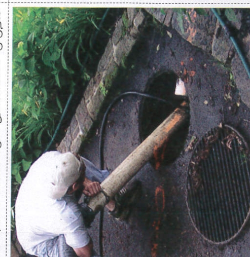
சலுலு ஂலுலு ஂலுலு ஂலுலு Cleaning drainage system நீர் இறங்கும் இடங்களை சுத்தம் செய்தல்