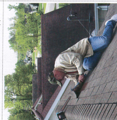
வலுலீலீ வலுலு ஂலுலு ஂலுலு Repairing leaking roofs கறையில் காணப்படும் துளைகளை முடுதல்