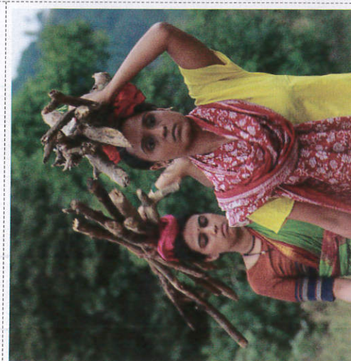
வீடிலீ ஂலுலு ஂலு ஂலுலீ Collecting Fire wood வீறகு சேகரித்தல்