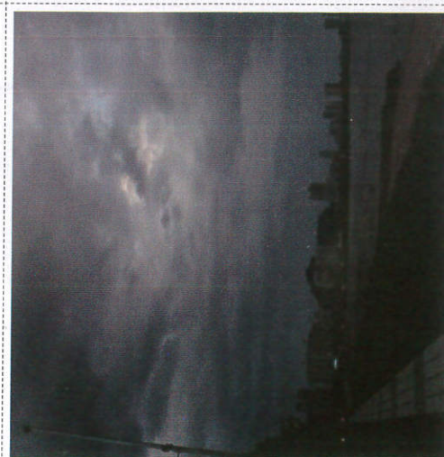
கிரடு வகிலுலு ஂலுலு ஂலுலு ஂலுலு ஂலுலு Environment turns dark when sun covers with clouds சூரியன் மறைவதால் சூழல் இருளடைதல்