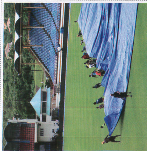
வீலீலீலீ ஂலுலு ஂலுலு கிரடு Covering Special Places விலேஷ்ட இடங்களை பாதுகாப்பாக வைத்தல்