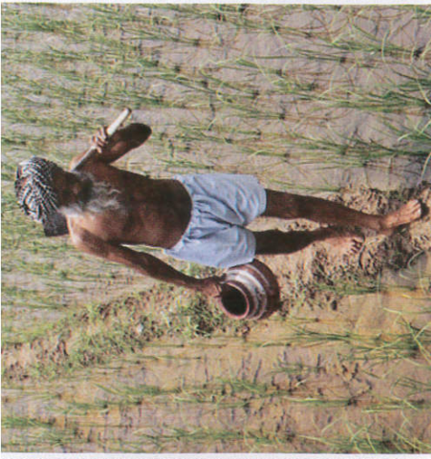
வசீகடு ஂசடு வடு வடு கிரடு Stopping work before rain மழைக்கு முன் வேலைகளை நிறுத்துதல்