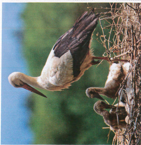
ஂலுலீலீ ஂடிலீ ஂலு ஂலு Birds flying to the nest பறவைகள் தங்கள் இறப்பிடங்கள் நோக்கி செல்லுதல்