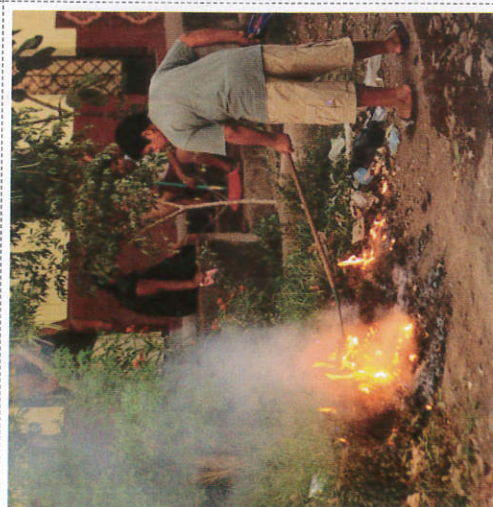
ஂலுலுலு சூலீகை ஂலுலீ Burning garbage குப்பைகளுக்கு நெருப்பு வைத்தல்