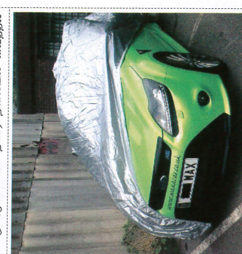
வீலுலுலீ ஂலுலு ஂலுலு ஂலு ஂலுலீ Covering vehicles parked outside வெளியே உள்ள வாகனங்களை முடுதல்