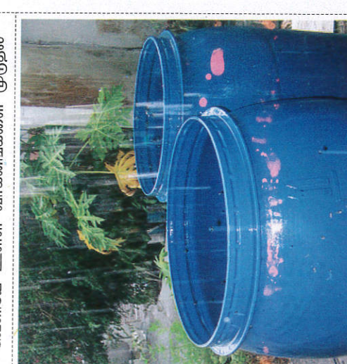
வகி சலுலு ஂலுலு ஂலுலு ஂலுலு Keeping vessels for rain water collection மழைநீர் பாத்திரங்களில் சேர்த்தல்