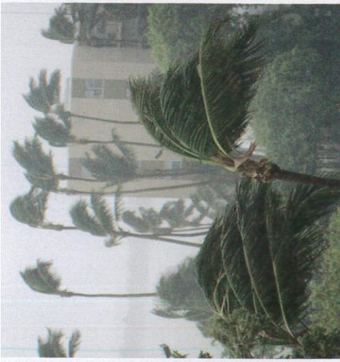
வேலையேன் சூலு ஂலீ Blowing of strong wind வேகமாக காற்று வசுதல்