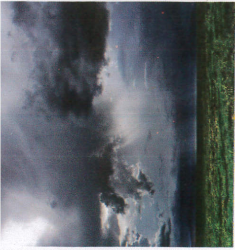
வகி வலுவுபு பரவீலீ Rain clouds appearing மேக கூட்டத்தின் வருகை