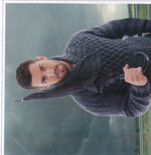
ஂலு சூலுலீ ஂலுலீ Getting ready with umbrellas குடைகளை தயார்நிலையில் வைத்தல்