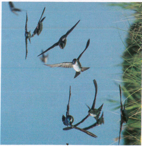
வகிலீகிலீயேன் சியலீ Swallow birds flying பறவைகளை பறத்தல்