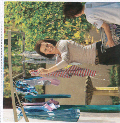
வீடிலீ ரேலீ ஂலீ Take out of dried clothes காய்ந்த ஆடைகளை வீட்டுக்குள்ளே எடுத்தல்