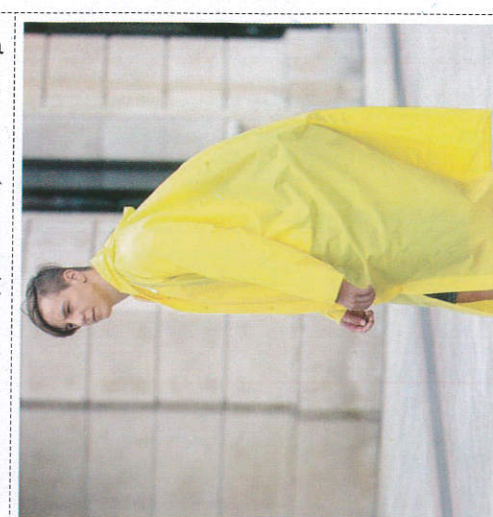
வகி ஂலு ஂலுலு சூலுலீலீ கிரடு Getting ready with raincoats மழை ஆடைகளை தயார் நிலையில் வைத்தல்