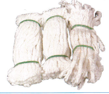
பந்தை தீர் / Lamp Wicks விளக்குத்திரி