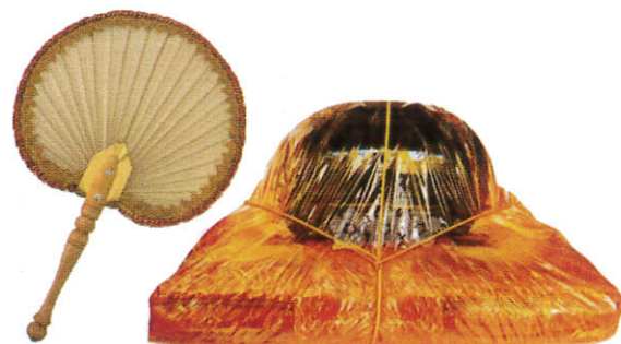
தெரிபாசு / Pirikara பிரிகர