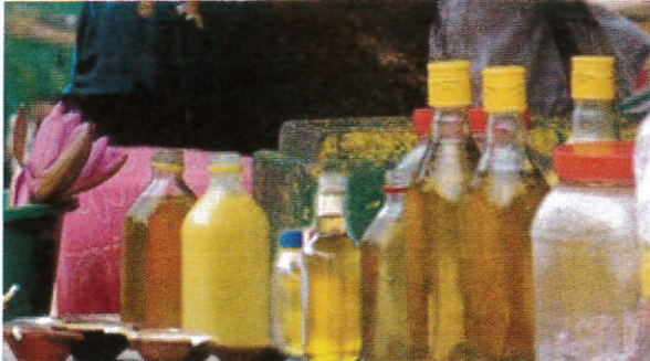
பேரீடுதெரி தெரிநீர் / Bottle of Coconut Oil தேங்காய் எண்ணை