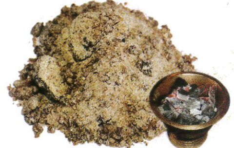
சூவர உதையல் / Incense Powder சாம்பிராணி