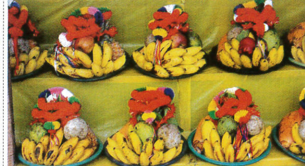
தெரி விரீடு / Wicker Tray of Fruits அர்ச்சனை தட்டு