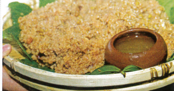
மூர்த்தனபத் / Muruthanbath முருதன்பத்