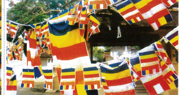
தெரி விரீடு / Line of Flags கொடி தோரணம்