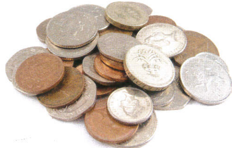
மாரை காசு (பட்டிர) / Coins for Charity காணிக்கை