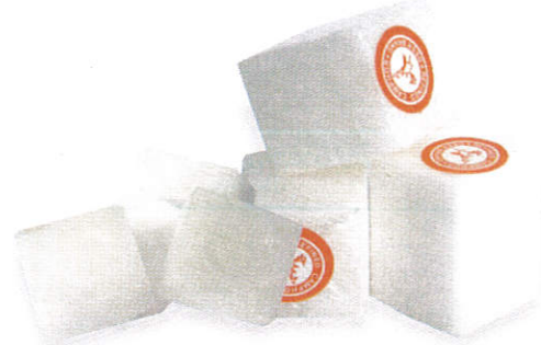
கட்டை / Camphor குடம்