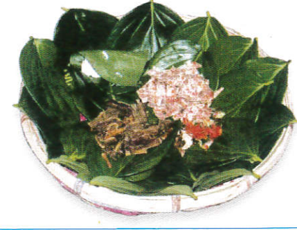
உதையல் விரீடு / Wicker Tray of Betle தாம்பூல தட்டு