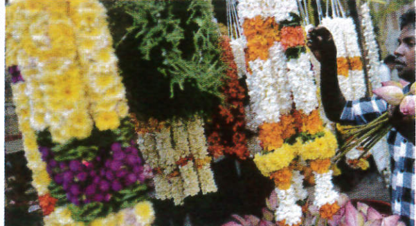
தெரி மாலா / Garlands மலர் மாலை