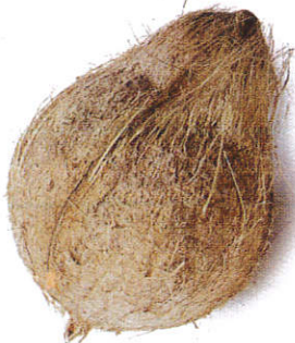
பேரீடு / Coconut தேங்காய்