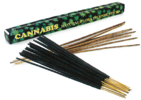
கடல்நீர் / Incense Sticks பத்தி