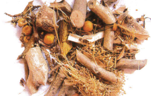
தெரிபாசு / Medicinal Herbs மருந்து பொருட்கள்