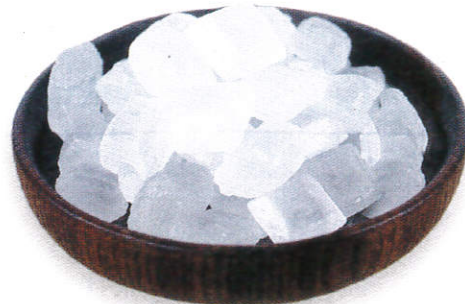
சூகிர / Candy கற்கண்டு