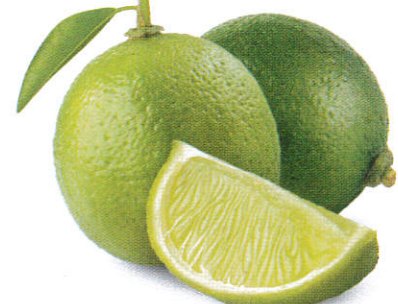
உதையல் / Lime Fruit எலுமிச்சை