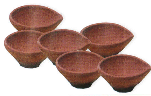
மேரீ பந்தை / Clay Lamps விளக்கு