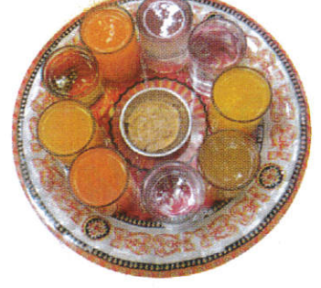
தெரிபாசு / Gilanpasa கிலன்பாசு