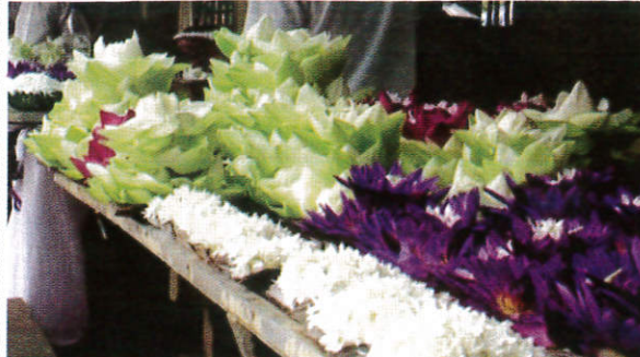
தெரி விரீடு / Wicker Tray of Flowers பூக் கூடை