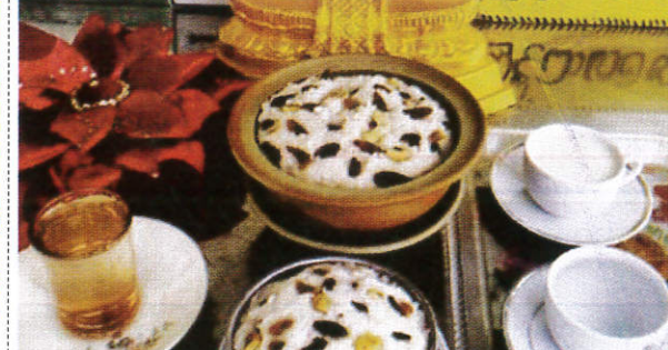
தெரி பானம் / Milky Food பால் உணவு