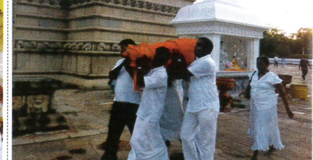
கபரூக / Kapruka கப்ருக