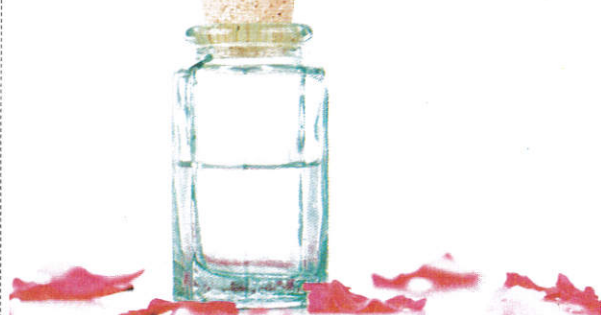
தெரி நீர் / Bottle of Rose Water பன்னீர்