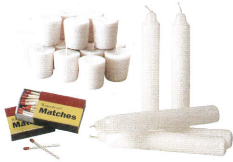
ஒரே பந்தை கை தெரி பேரீடு / Candles & Box of Matches மெழுகுவர்த்தியும் தீப்பெட்டியும்