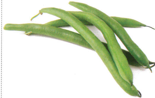
போஞ்சி Beans போஞ்சி