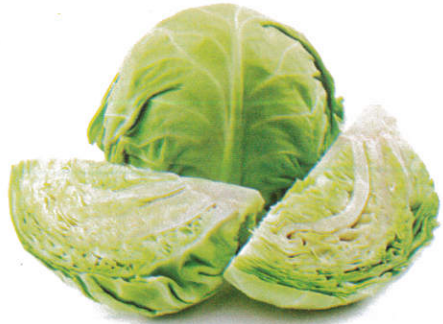
கோவா Cabbage கோவா