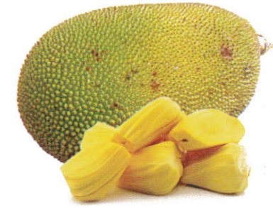
பலாக்காய் Jak Fruit பலாக்காய்