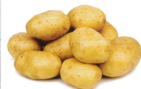
கிழங்கு Potatoes உருளைக் கிழங்கு