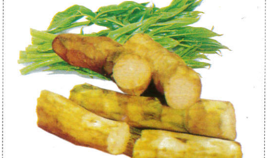
கொகிலக் கிழங்கு Kohila கொகிலக் கிழங்கு