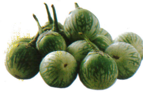
வட்டுக் காய் Egg Plant வட்டுக் காய்