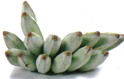
வாழைக் காய் Ash Plantain வாழைக் காய்