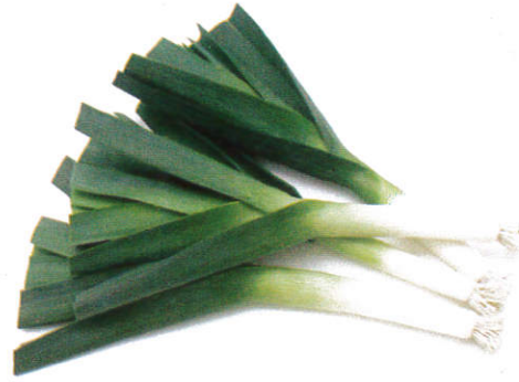
லீக்ஸ் Leeks லீக்ஸ்