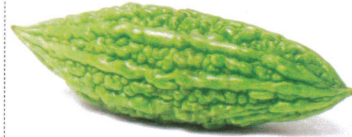
பாகற்காய் Bitter Gourd பாகற்காய்