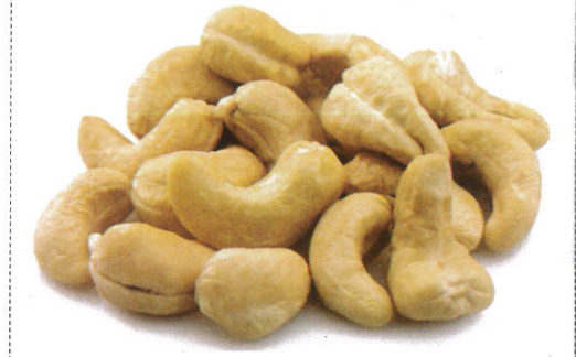
முரமுந்திரி Cashew Nut முரமுந்திரி