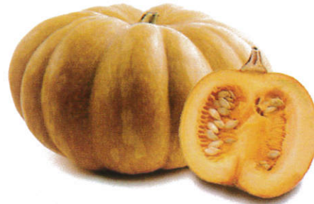
பூசணி Pumpkin பூசணி