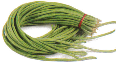
பயிற்றங் காய் Long Beans பயிற்றங் காய்