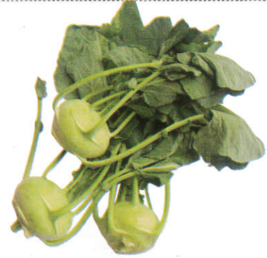
நோக்கோல் Knol Khol நோக்கோல்