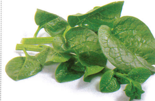
புசணி Spinach புசணி