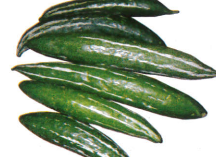
புடோல் Snake Gourd புடோல்