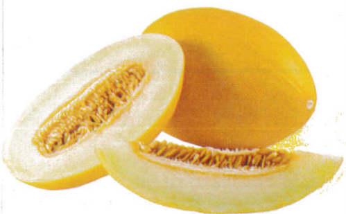
கெக்கரி காய் Marrow கெக்கரி காய்