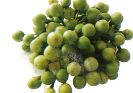
சுண்டைக் காய் Pea Eggplants சுண்டைக் காய்