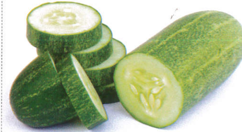
வெள்ளரிக் காய் Cucumber வெள்ளரிக் காய்