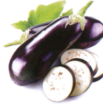
கத்திரிக் காய் Brinjal கத்திரிக் காய்