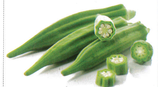
வெண்டைக் காய் Ladies Fingers வெண்டைக் காய்