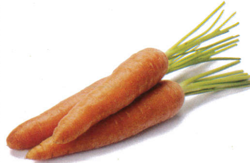
கரட் Carrot கரட்