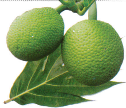
ஈரப்பலா Bread Fruit ஈரப்பலா