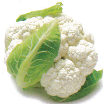
கோவா Cauliflower பு கோவா