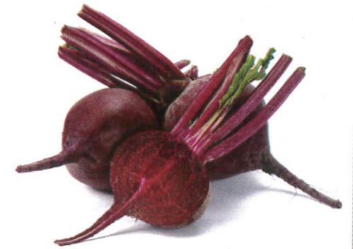
பீட்ரூட் Beetroot பீட்ரூட்