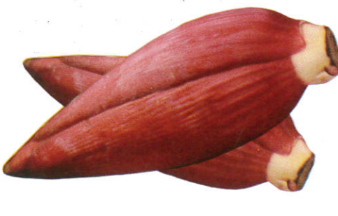
வாழைப் பூ Banana Flower வாழைப் பூ