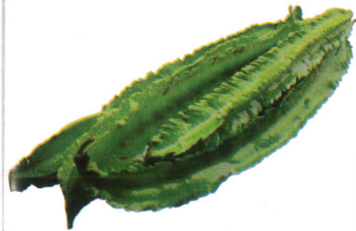
அவரை Winged Bean சிறகு அவரை