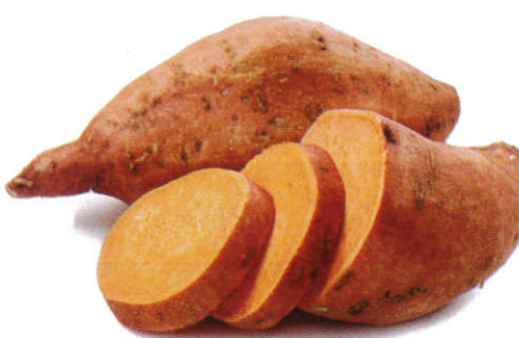
கிழங்கு Sweet Potato வற்றாலங் கிழங்கு