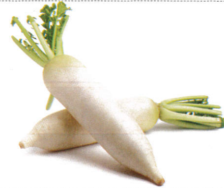
முள்ளங்கி Radish முள்ளங்கி