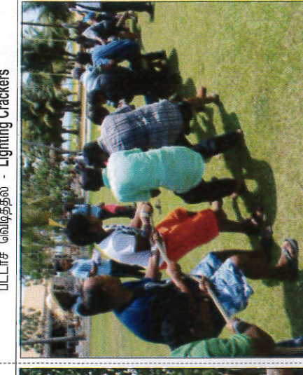
කම ඇදීම கயிறு இழுத்தல் - Tug-of-War