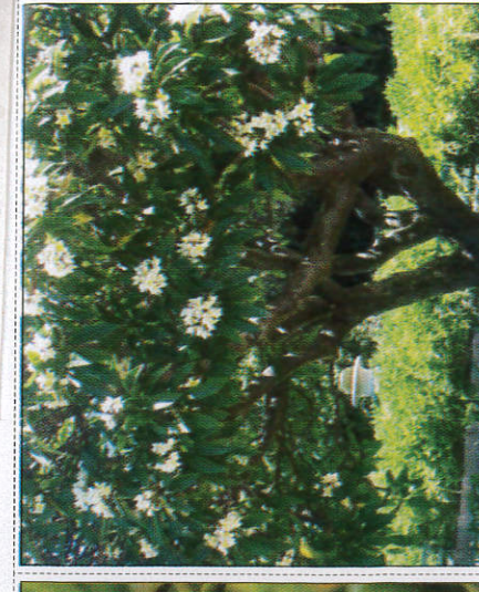
ගස් මලින් බර වීම பூக்கள் மலர்தல் - Blossoming of flowers in trees