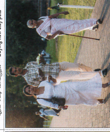
පන්සල් යාම கோயிலுக்கு செல்லல் - Going to temple