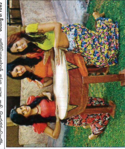
රබන් ගැසීම ரபன் தட்டுதல் - Playing the Raban