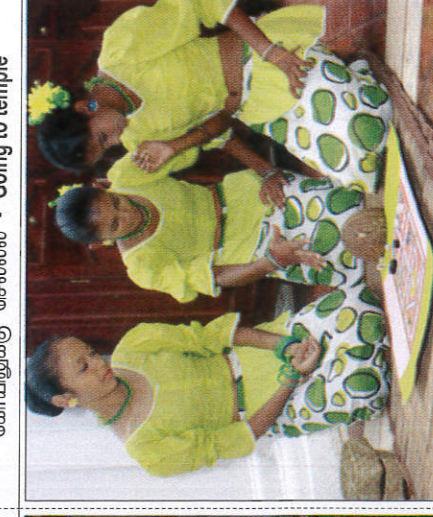
පාටි දැමීම நோவி உருட்டல் விளையாட்டு - Playing Pancha