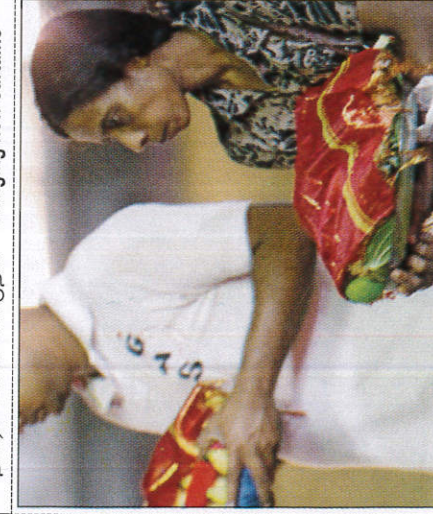
අවුරුද්දේ පෙර බාර හාර බස්සු කිරීම பூலாரு-த்திற்கு முன் கூள் பாரம் ஒப்புக்கொடுத்தல் - Selling of vovus