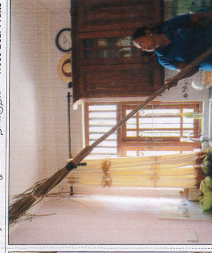
මකුළු දැමූ කැසීම சுத்தம் செய்தல் - Removing cobwebs