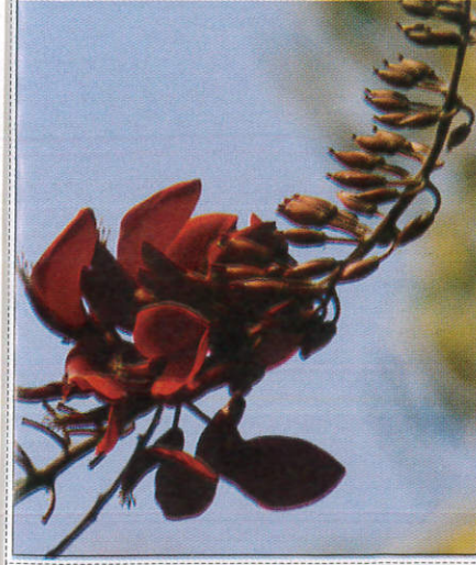
එරබදු මල් පිපීම ஏரபந்து மலர் மலர்தல் - Blooming of Erabadu Flowers