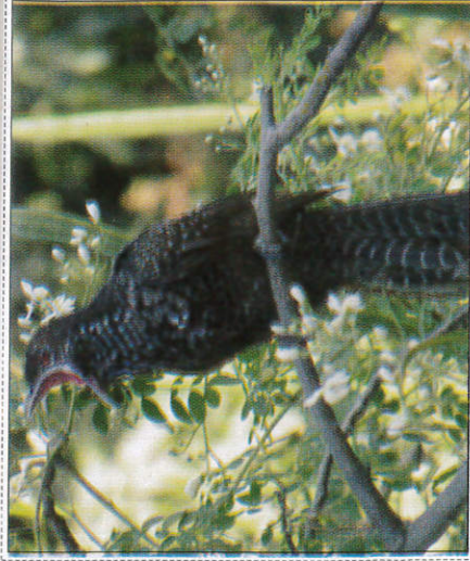
කොවුල් නාදය ඇසීම குயில் கூற்தல் - Singing of the Cuckoo bird