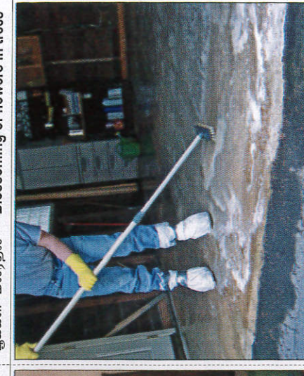
කිම කේළීම தரை சுத்தம் செய்தல் - Cleaning the floor