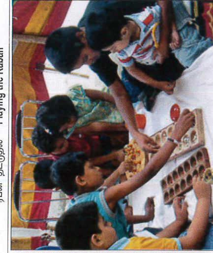
මලිදි කෙළිය ஒளிந்த கேளியா - Olinda Keliya