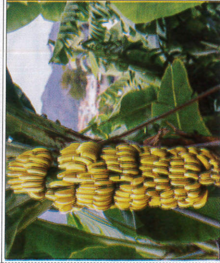
කෙසෙල් කැන් ඉදවීම வாழையும் பழுத்தல் - Ripening of Bananas