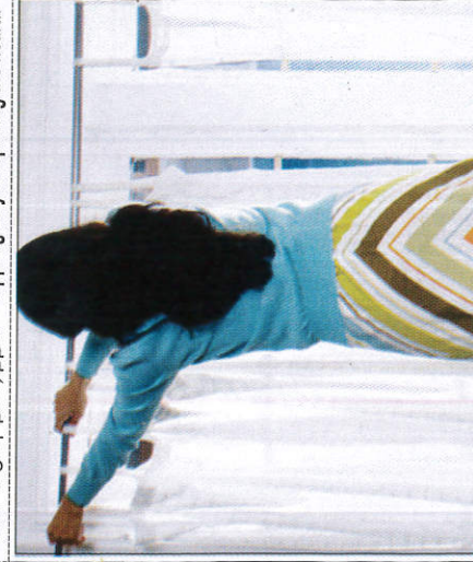
අළුත් කිරි රෙදි දැමීම திரைச் சீலை போடுதல் - Hanging new curtains