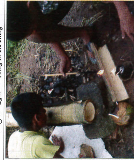
උණ මඩි පන්දුකිරීම மூங்கில் வெடி - Lighting Bamboo