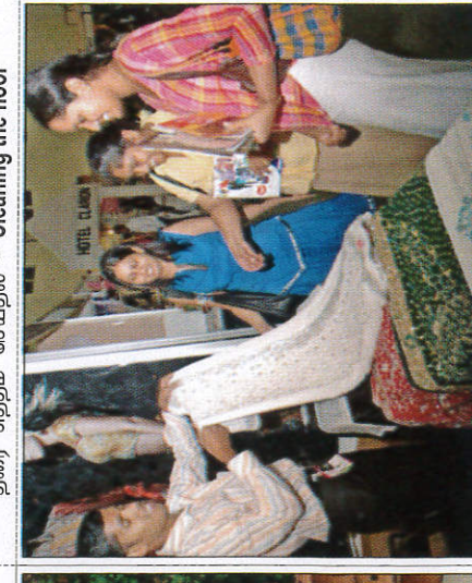
අළුත් ඇඳුම් ගැනීම புத்தாடை வாங்குதல் - Buying new clothes