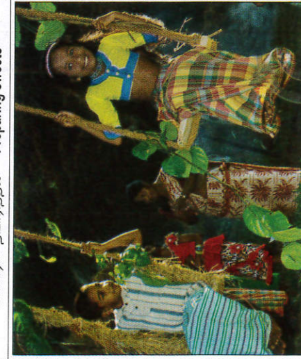
ඔහ්ට්ලි පැදීම ஊஞ்சல் ஆடல் - Going on the swing