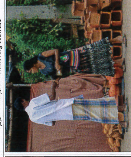
අළුත් වලං, අනිලි මිලදී ගැනීම புதிய சட்டி வாங்குதல் - Buying new clay pots