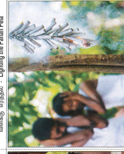
රනිකුටු පන්දුකිරීම யட்டாசு வெறத்தல் - Lighting Crackers