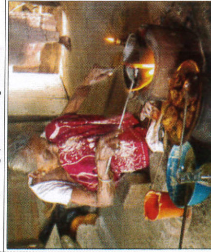
කැපිලි සෑදීම பலகாரம் தயாரித்தல் - Preparing sweets