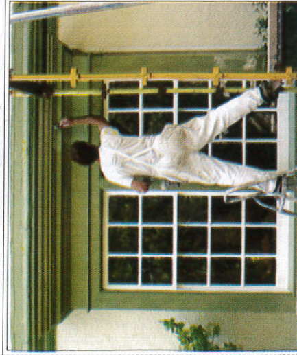
නිවස පින්තාරු කිරීම வர்ணம் பூசுதல் - Painting the house