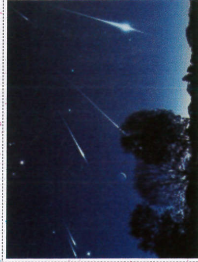
චන්ද්‍රා වැස්ස Meteor Shower - விண்கற்கள் மழை