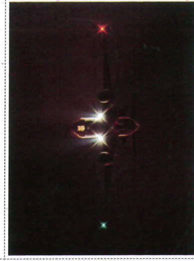
ඉවන් යානා Aeroplane - ஆகாயவிமானம்