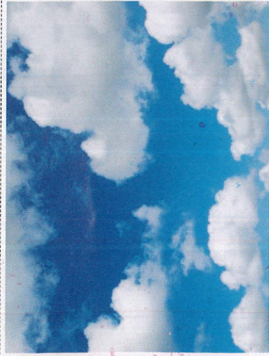
ලලාකුළු Clouds - மேகங்கள்