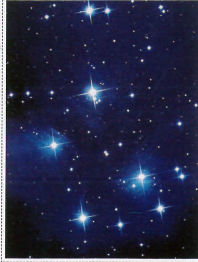
තරු Stars - நட்சத்திரங்கள்