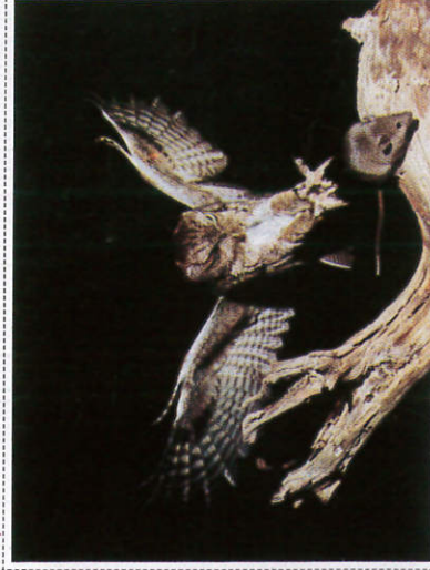
චෛලිණ Owl - ஆந்தை