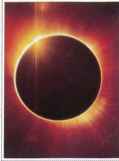
සූර්යග්‍රහණය Solar Eclipse - சூரிய கிரகணம்