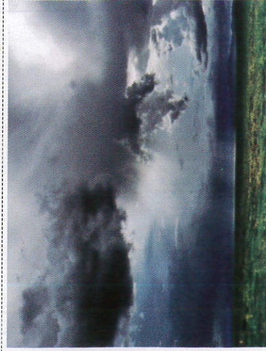
වැනි ලලාකුළු Rain Clouds - மழை மேகங்கள்