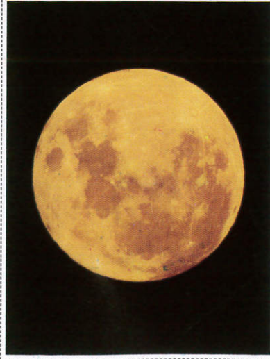
සඳු Moon - சந்திரன்