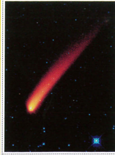
ධූමකේතුව Comet - வால்மீன்கள்