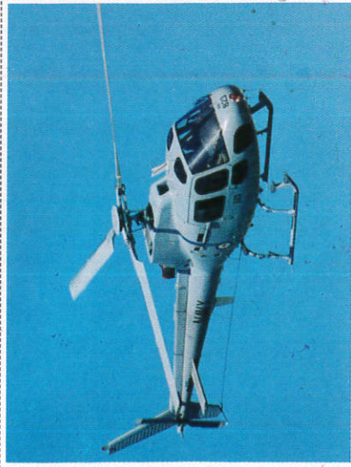
කෙලිකෝප්ටර් Helicopter - ஹெலிகොப்டர்