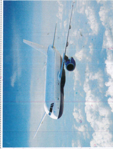
ඉවන් යානා Aeroplane - ஆகாயவிமானம்