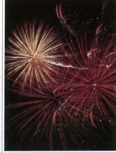
මල් වෙඩි Fire Works - மல்வெடி