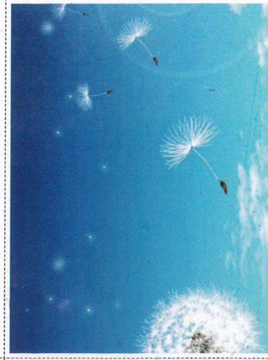
වරා මල් Parachute Seeds - பரகூட் விதைகள்