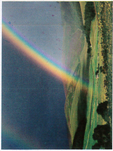
දේදුන Rainbow - வானவில்