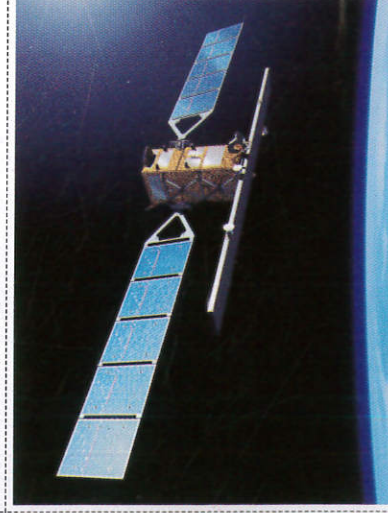
චන්ද්‍රිකා Satellite - துணைக்கோள்