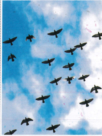
පක්ෂීන් Birds - பறவைகள்