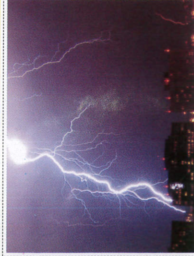
අඟුණු Lightning - மின்னல்