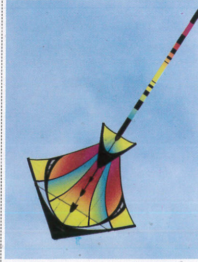
සරලකුළය Kite - பட்டம்