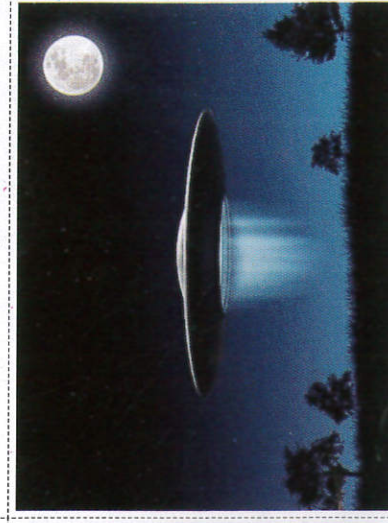
පිටිකේවල යානා Aliens Aircraft - வெளிநாட்டினர் விமானம்