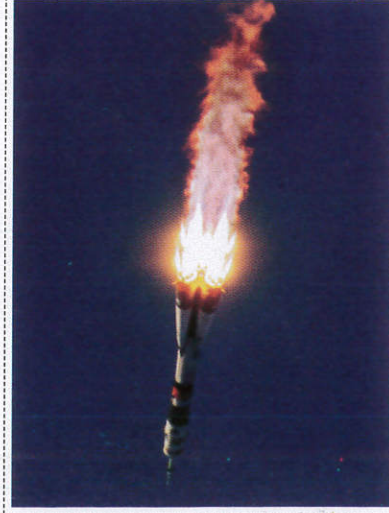
රොකට් Rocket - ரொகட்