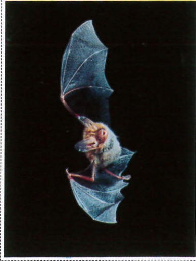
චූචුලා Bat - வெள்வால்