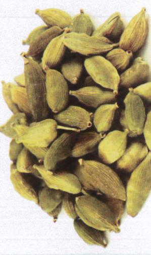
கர்டாமம் - Cardamoms ஏலம்