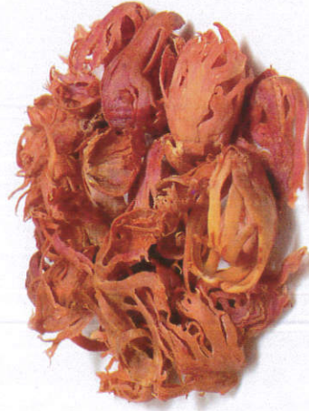
பைலிங் - Mace வாசனைப் பொருட்கள்