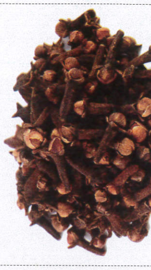
கரூ - Cloves கரூ