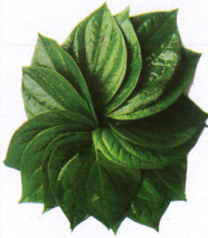
இல - Betel பெற்றிலை