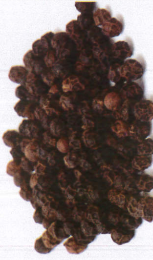
பிளாக் - Black Pepper பிளாக்