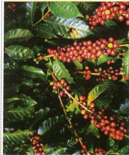
கோப்பி - Coffee கோப்பி