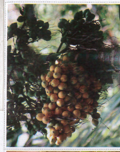
அரேகா - Arecanut பாக்கு