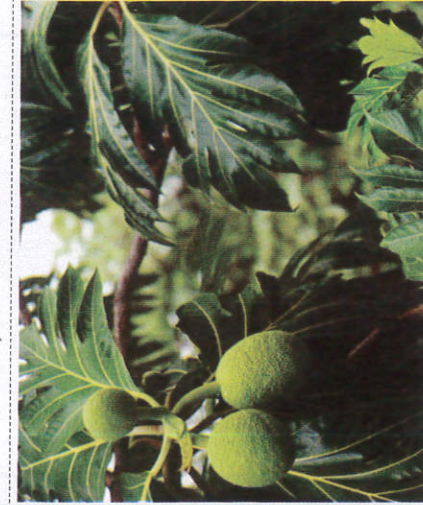
பிரட் - Breadfruit பிரட்