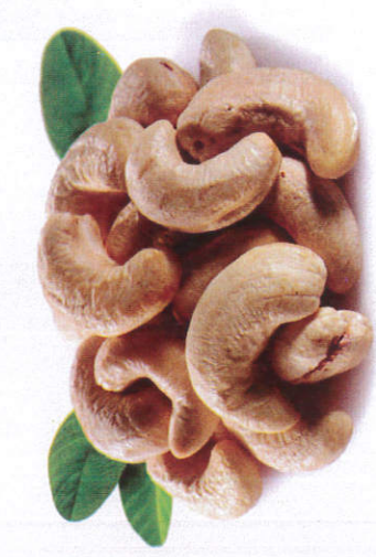
கசு - Cashew nuts கசுக் கொட்டை