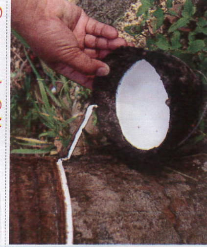
ரபர் - Rubber இறப்பர்