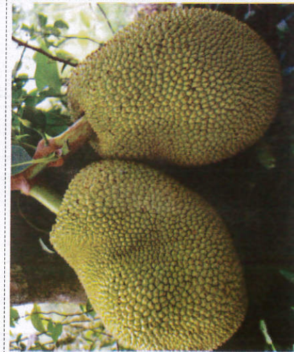
பலா - Jackfruit பலா