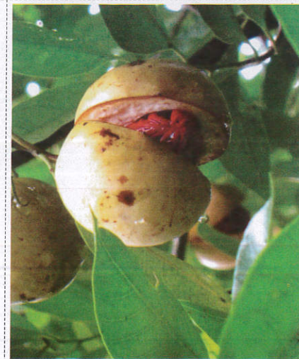
பைலிங் - Nutmeg சாதிக்காய்