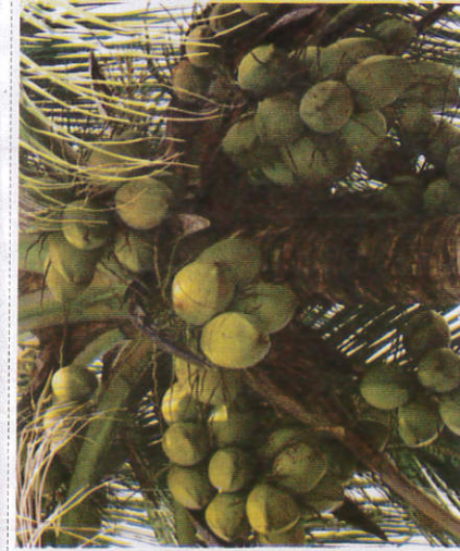
கோ - Coconut தேங்காய்