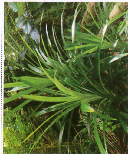
ரம்பை - Rampa leaves ரம்பை