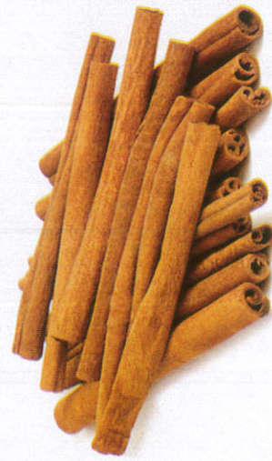
கருவா - Cinnamon கருவா