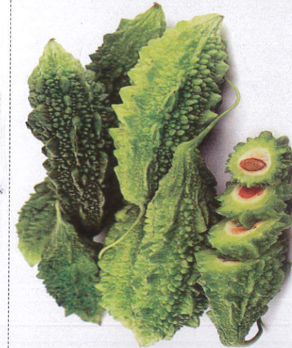
பைலிங் - Bitter Gourd பாகற்காய்