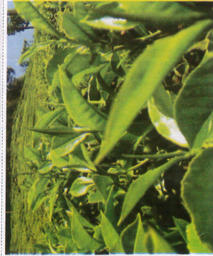
தே - Tea தேயிலை