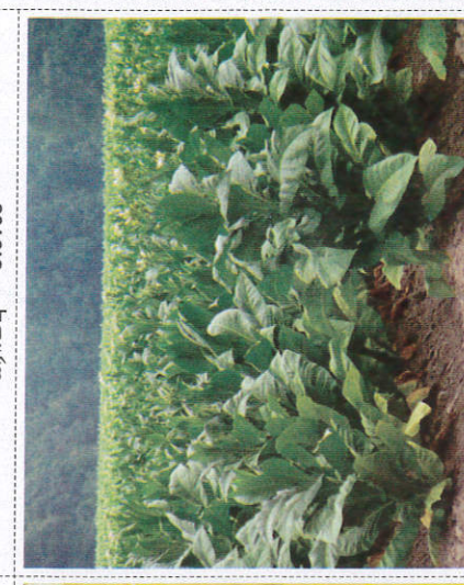
டாபாக்கோ - Tobacco புகையிலை