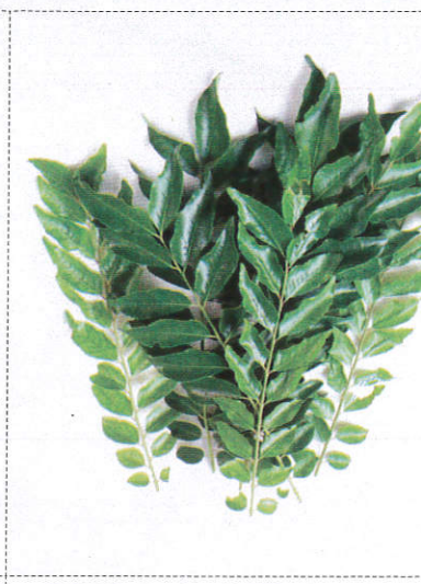
கரூ - Curry Leaves கரூ