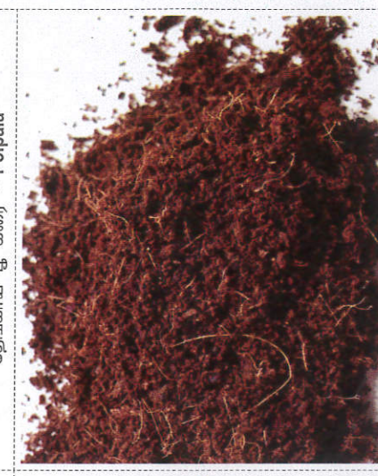
கோ - Coir dust கோ