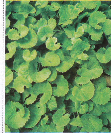
கோ - Gotukola வல்லாரை