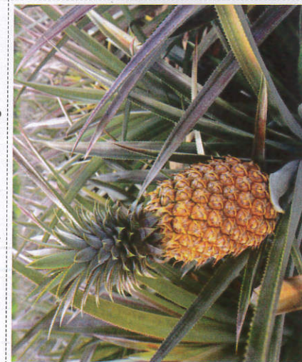
பைலிங் - Pineapple அன்னாசி