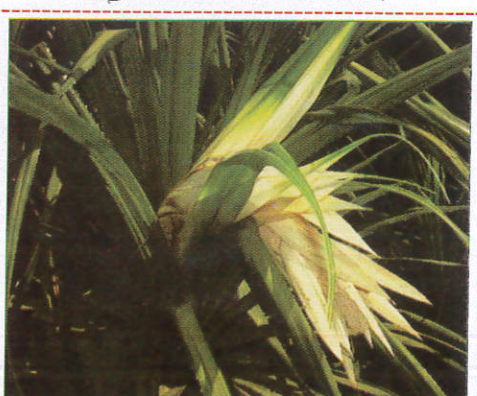
වැටකෙයියා Pandanus tectorius தாமும்பூ (தாமும்பூ)