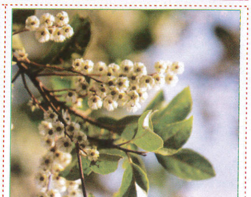
වෙරළ Veralu வெரலி (வேரலி)