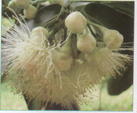
ජමබු Rose Apple ஐம்பூ (சமீபூ)