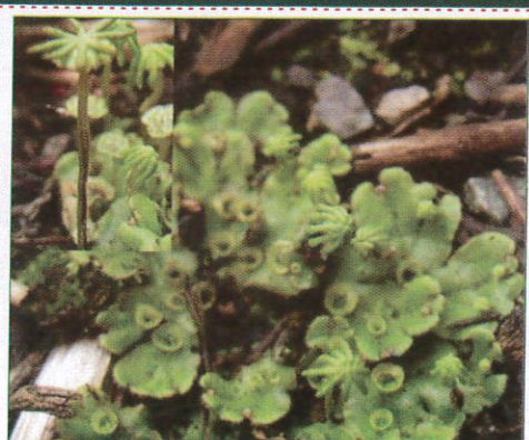
මාකාන්ටියා Marchantia மாகான்டியா (மாகான்டியா)