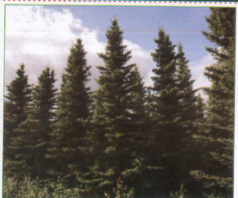
පයින් Pine பயின் (பயின்)