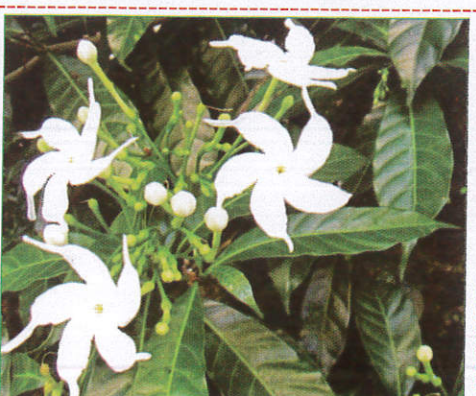
වතු සුද්ද Wathusudda Flower நித்தியக்கல்யாணி (நித்தியக்கல்யாணி)