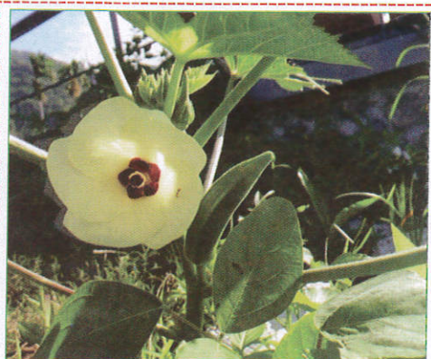
බණ්ඩක Ladies Fingers வெண்டிக்காய் (வேலிப்பீக்காய்)