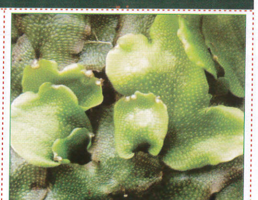
පාසි Algae பாசி (பாசி)