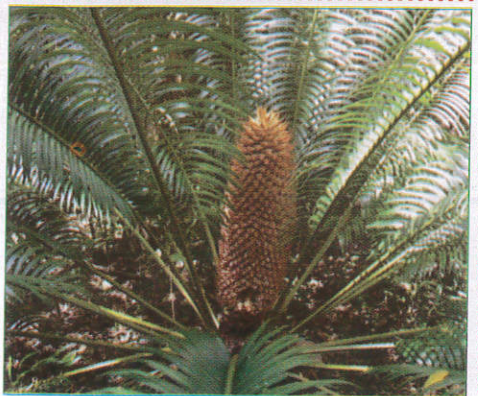
මඩු Madu மடு (மடு)