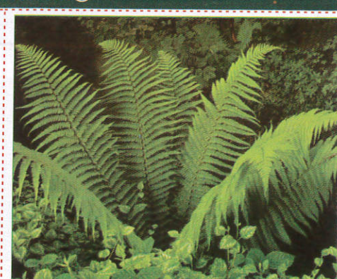
මිචන Ferns மீனா (மீனா)