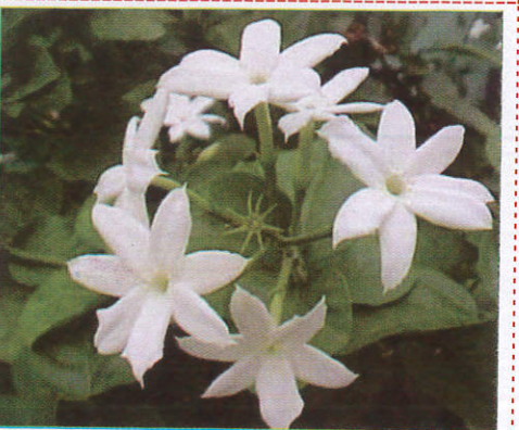
ජිලි Jasmine மல்லிகை (மல்லிகை)