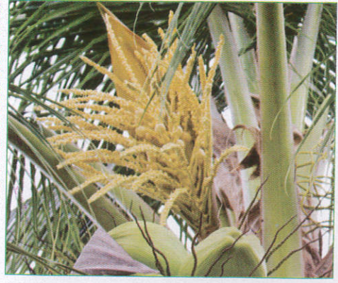
පොල් මල Coconut Flower தென்னம்பூ (தேனீழை)