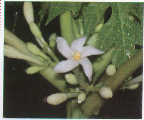
ගස් ලබු Papaya பப்பாசி (பச்சாசி)