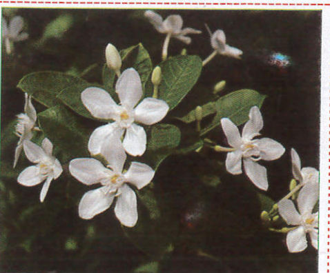
ඉද්ද Iddha காட்டு மல்லிகை (கார்பூ மல்லிகை)