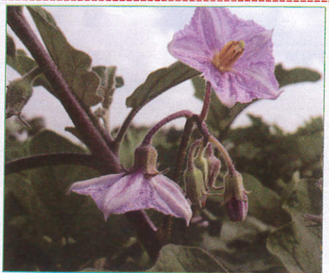
වමබල Brinjal கத்தரி (கத்தரி)