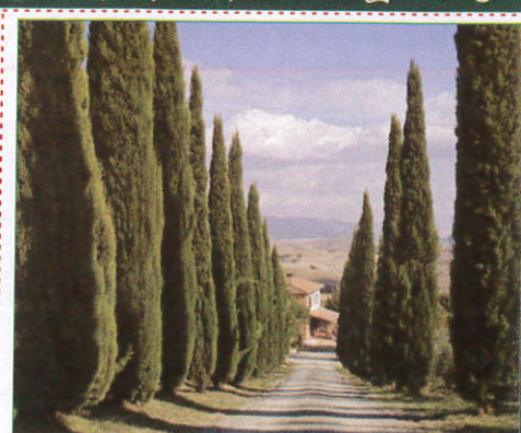
සයිප්රස් Cypress சயிப்ரஸ் (சயிப்ரஸ்)