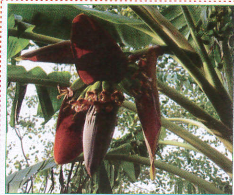
කෙසෙල් Banana வாழைப்பூ (லாலேசிப்பூ)