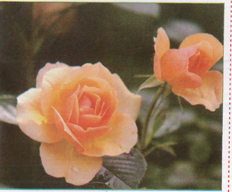
රෝස Rose ரோஜா (ரோச)