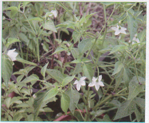
මිරිස් Chilli மிளகாய் (மிளகாசி)