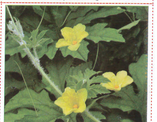
කරළ Bitter gourd பாகற்காய் (பாடுக்காய்)