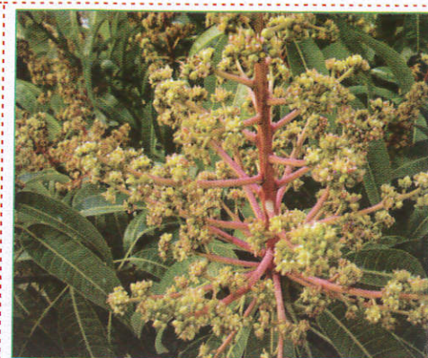
අඹ Mango மா (மா)