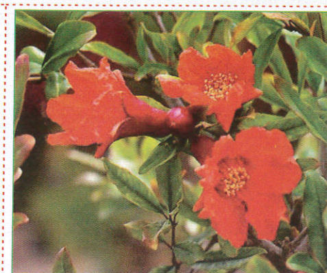
දෙළුම් Pomegranate மாதுளை (மாதுளை)