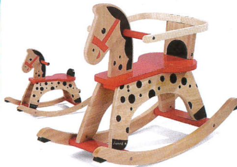
■ ஈலிதலே னாண்டி ( பிலிமி ஈலி பிலி ) Toy items ( Different types of wood ) விளையாட்டு பொருட்கள்