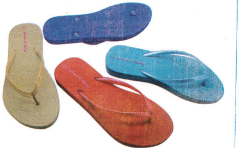
■ பசுலி ( ரஃபர் தலே கிர ) Shoes ( Rubber tree latex ) பாதணிகள்