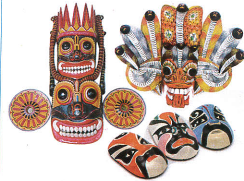
■ ஈலிதலே ஈலி ( பிலிமி ஈலி பிலி ) Traditional masks ( Wood ) முகாமுகங்கள்