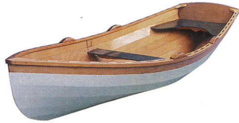
■ திரிப னாது ( பிலிமி ஈலி பிலி ) Fishing vessels ( Different types of wood ) மீன்பிடி கலன்கள்