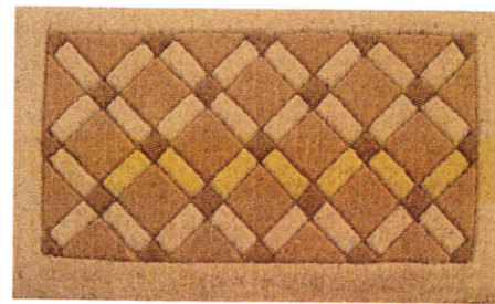
■ பசுலி ( பசுல் மோது ) Door mats ( Coconut fibre ) கால் துடைப்பான்