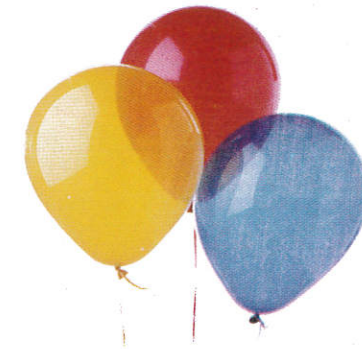
■ டைரி ( ரஃபர் தலே கிர ) Balloons ( Rubber tree latex ) புலுள்கள்