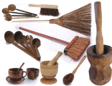
■ னாது ஈலகர்சா ( பசுல் தபு, ஈலி, மோது ஈன பிலிமி ஈலி ) House hold items ( Coconut shells, husks, fibre and wood ) வீட்டு பொருட்கள்