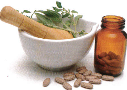
■ ஈலிதலே பிலி ( னாது ஈலி, ஈலி, மோது, ஈலி ) Medicine ( Roots, Fruits, Leaves and Flowers ) மருந்து வகைகள்