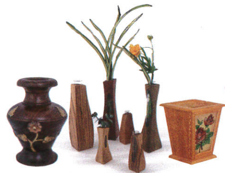
■ ஈலி தலே ( பிலிமி ஈலி பிலி ) Flower vases ( Different types of wood ) பூஞ்சாடிகள்