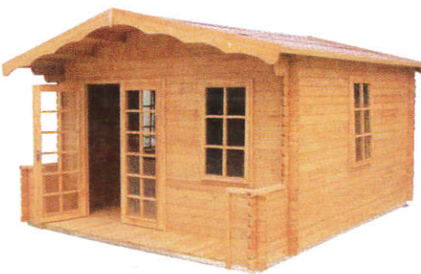
■ கிலி ( பிலிமி ஈலி பிலி ) Houses ( Any woods ) வீடு