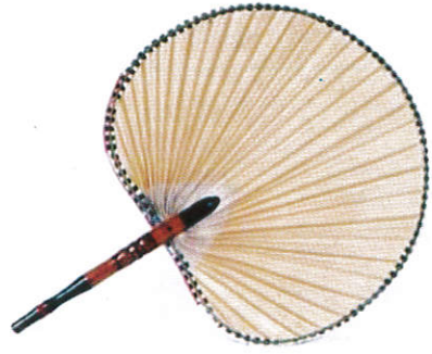
■ பூசு னாண்டி ( தல் மோது ) Offering equipments (Palmyra leaf) பூசு னாண்டி - மெத்தை