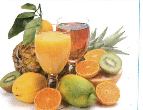
■ னாது பிலி ( பிலிமி பசுலி ஈலி ) Drinks ( Any fruits ) பானம்