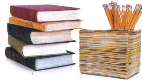
■ ஈலி ஈலி ( னாது பது ) Stationary ( Leaves ) காகிதங்கள்