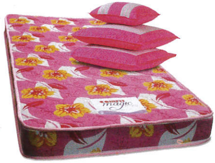
■ மோட்டி - மெட்டி ( பசுல் மோது ஈன பூலி ) Pillows and Mattresses ( Coconut coir and cotton ) தலையணைகள் - மெத்தை