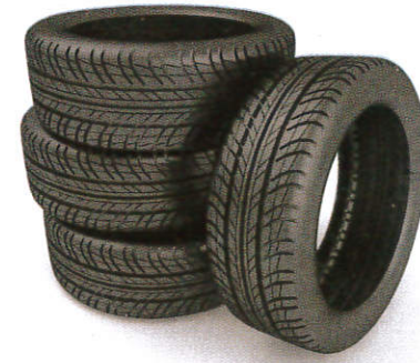
■ டைரி ( ரஃபர் தலே கிர ) Tyres ( Rubber tree latex ) டயர்