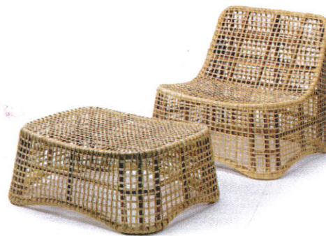
■ பிலிதலே னாண்டி ( பிலிதலே னாது ஈலி ) Rattan products ( Rattan plant ) பிரம்பு தயாரிப்புகள்