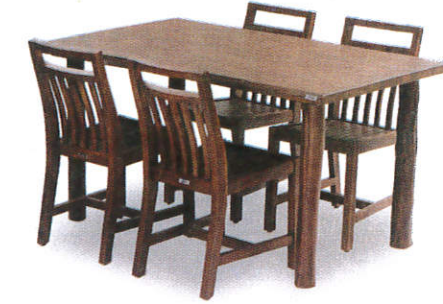
■ னாது னாண்டி ( பிலிமி ஈலி பிலி ) Furniture ( Different types of wood ) மர தளபாடங்கள்