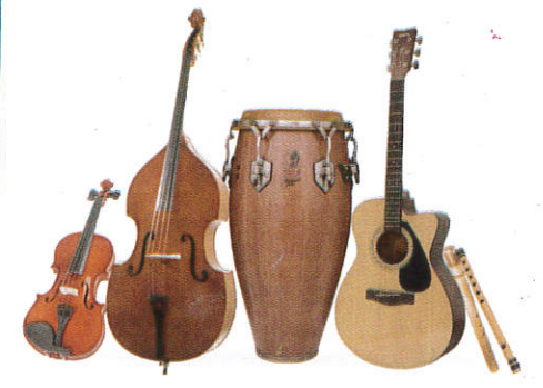
■ ஈனின னாண்டி ( பிலிமி ஈலி பிலி ) Music instruments ( Different types of wood ) இசை கருவிகள்