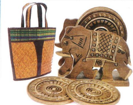
■ ஈலிதலே னாண்டி ( பிலிமி ஈலி பிலி, பசுல்/பிலிமோது னாது பது ) Handy craft ( Different types of wood and leaves ) கைவினைகள்