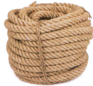
■ மோது ஈலு / தபு ( பசுல் மோது ) Coir ropes ( Coconut fibre ) கயிறு கயிறுகள்