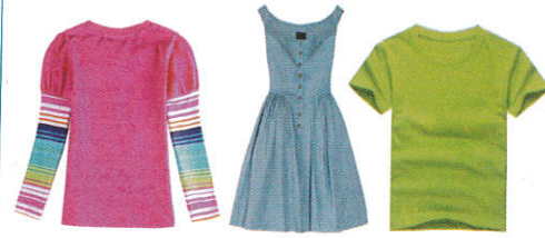
■ ஈரதலுமி கிஷ்பாது ( தபு துல் ) Garments products ( Cotton threads ) தையல் உறபுத்தி