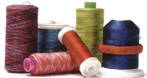
■ துல் பிலி ( தபு பூலி ) Threads ( Cotton ) நூல் வகைகள்