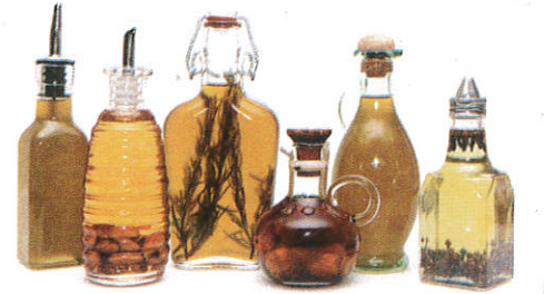
■ தலே பிலி ( னாது ஈலி, ஈலி, மோது ) Any oils ( Roots, Fruits and Leaves ) எண்ணெய்