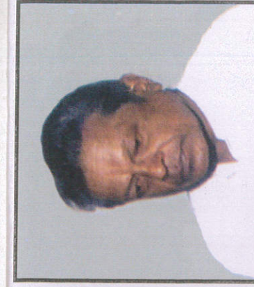
ගුණදාස අමරසේකර Gunadasa Amarasekera குநதாச அமரசேகர