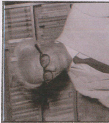
මාර්ටින් වික්රමසිංහ Martin Wickramasinghe மார்டின் விக்ரமசிங்கஹி