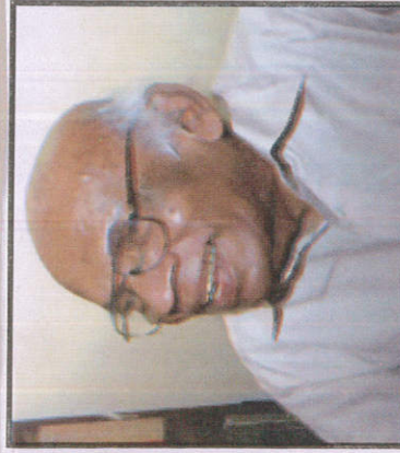
ආතර් සී. ක්ලර්ක් Athur C. Cleark ஆதர் சீ. க்லர்க்