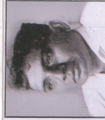
මහගමසේකර Mahagama Sekera மககமசேகர