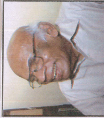
මොවාර්ස් එදිරවීර සරත්චන්ද්‍ර Prof. Edirweera Sarathchandra எதிரவேர சரத்சன்ச