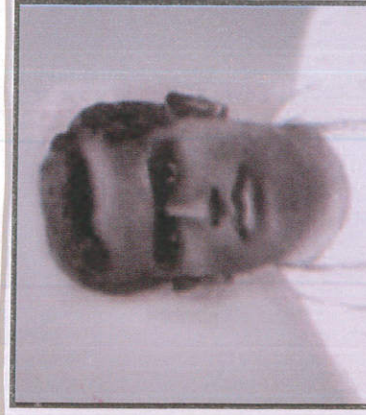
බලන්ගොඩ ආනන්ද මෙත්‍රිය තේරෝ Balangoda Ananda Methriya Thero. பலங்கோட ஆனந்த மெத்ரிய