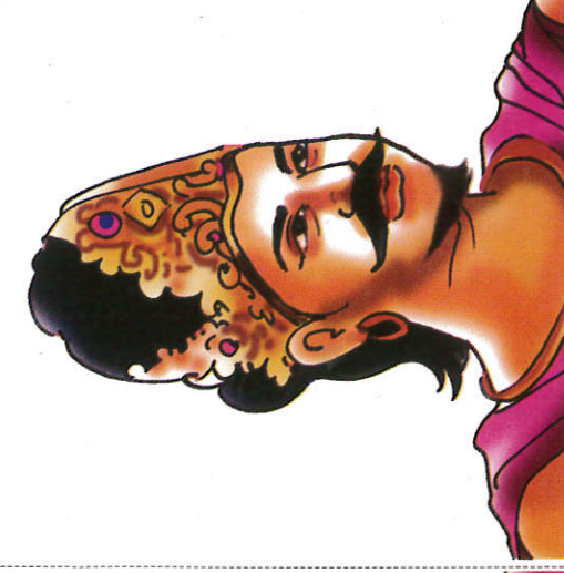
மிஹிந்த மன்னன் ரத்ர King Mihindu மிஹிந்த மன்னன்