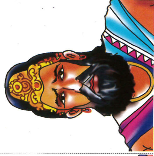
புத்ததாச ரத்ர King Buddhadasa புத்ததாச மன்னன்