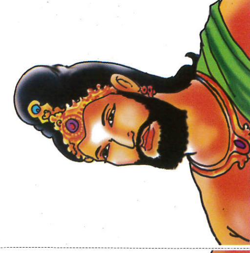
தேவநம்பியத்திச ரத்ர King Dewanampiyathissa தேவநம்பியத்திச மன்னன்