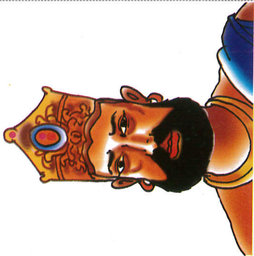
தாதுசேன மன்னன் ரத்ர King Dhatusena தாதுசேன மன்னன்