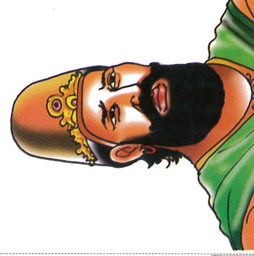
மகா பராக்கிரமபாரு மன்னன் ரத்ர King Maha Parakramabahu மகா பராக்கிரமபாரு மன்னன்