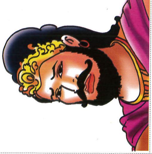
வலகம்பா ரத்ர King Walagamba வலகம்பா மன்னன்