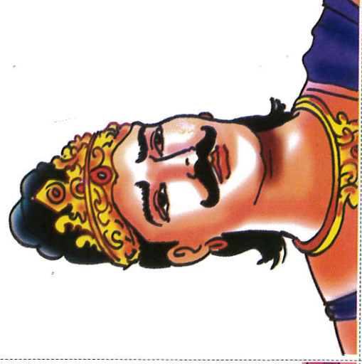
மகாசேன ரத்ர King Mahasen மகாசேன மன்னன்