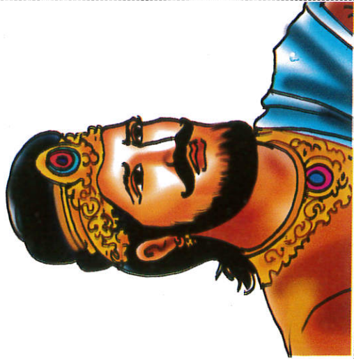
காசியப மன்னன் ரத்ர King Kashyapa காசியப மன்னன்