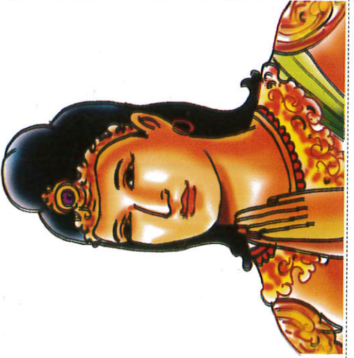
துட்டகைமுனு ரத்ர King Dutugemunu துட்டகைமுனு மன்னன்