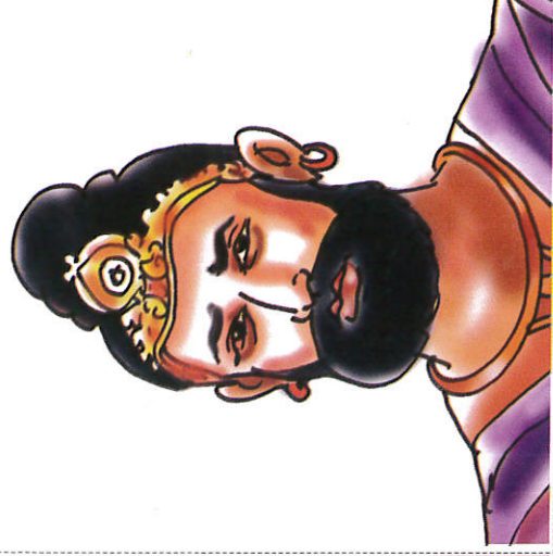
சிவாலி ருசங்க இராஜசிங்க மன்னன் ரத்ர King Seethawaka Rajasinghe சிவாலி ருசங்க இராஜசிங்க மன்னன்