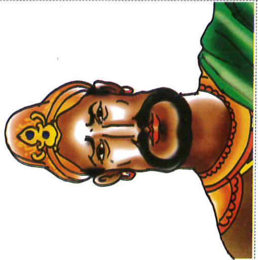
எல்லாள மன்னன் ரத்ர King Elara எல்லாள மன்னன்