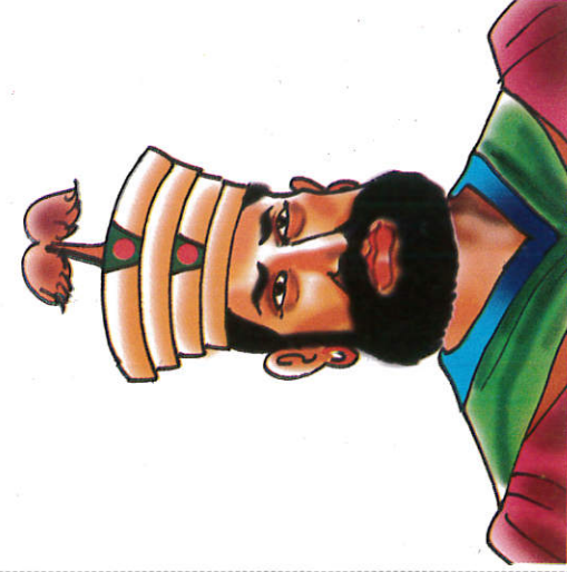
கீர்த்தி ஸ்ரீ இராஜசிங்க மன்னன் ரத்ர King Keerthi Sri Rajasinghe கீர்த்தி ஸ்ரீ இராஜசிங்க மன்னன்