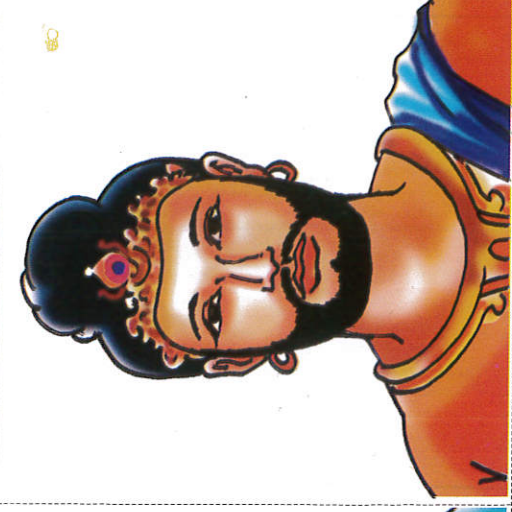
பண்டுகாபய ரத்ர King Pandukabaya பண்டுகாபய மன்னன்