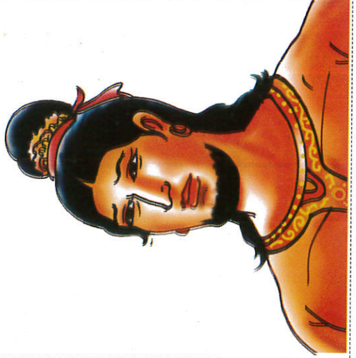
வியச ரத்ர King Vijaya விஜய மன்னன்