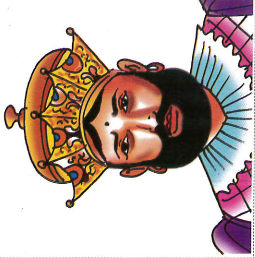
ஸ்ரீ விக்கிரம இராஜசிங்க மன்னன் ரத்ர King Sri Wickrama Rajasinghe ஸ்ரீ விக்கிரம இராஜசிங்க மன்னன்