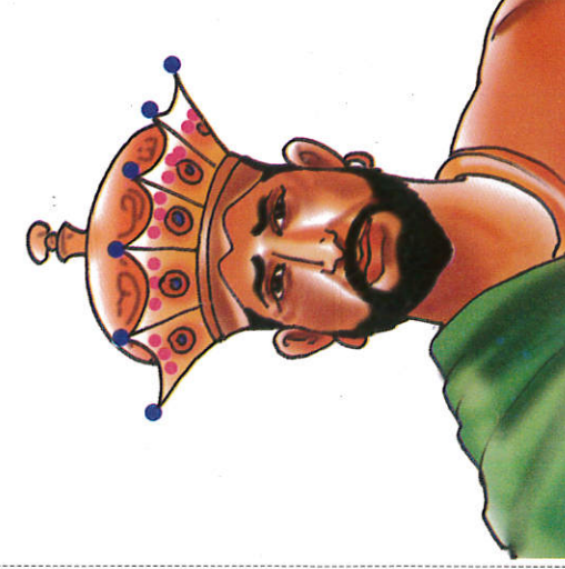
காவந்திசு மன்னன் ரத்ர King Kawanthissa காவந்திசு மன்னன்