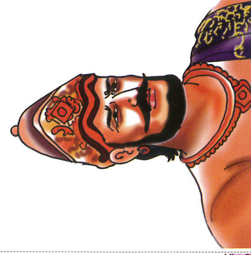
நிசங்கமல்ல மன்னன் ரத்ர King Nissankamalla நிசங்கமல்ல மன்னன்