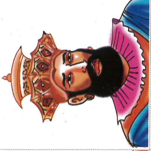
விலஹரத்ர King Wimaladharmasuriya விமலதர்மசூரிய மன்னன்