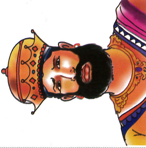
விஜயபாரு மன்னன் ரத்ர King Vijayabahu விஜயபாரு மன்னன்