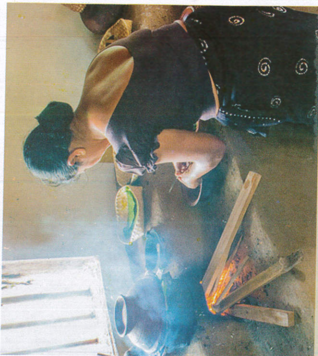
■ ஈனாப் பிட்டு Cooking food உணவு சமைத்தல்