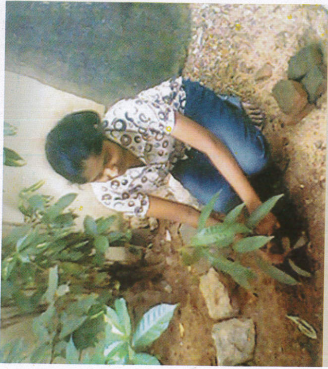
■ பீயி ஈரலீடு Attending work வேலைதொடங்குதல்