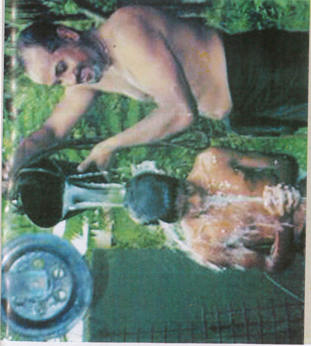
■ பீலாவைய Bathing நீராடல்