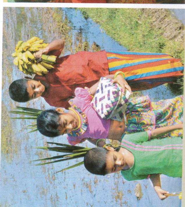
■ ஈலில் ஈழலீ ஈழ மலி மலி Visiting relatives புத்தாடை அணிதல் உறவினர் வீடு செல்லல்