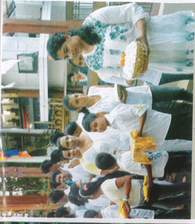
■ மலி மலி மலி மலி Attending meritorious activities நல்லதொழிந்தல்கோவில செல்லல்