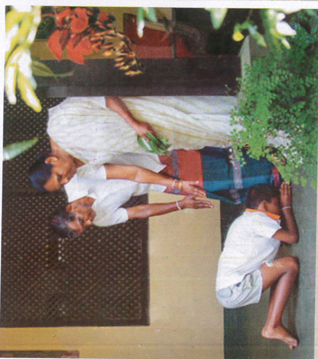
■ இலை ழுயல் ழீ ழுலெயின் பூலீடு Offering beetle sheaves to parents வேழரிசைல கொடுத்து பெற்றோரைணைங்குதல்