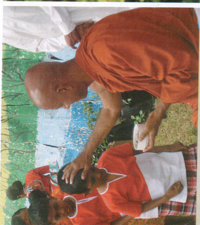
■ மீய மலி மலி Anointing oil தலைக்கு ஈண்ண தேய்த்தல்