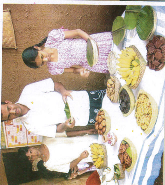
■ ஈனாப் ஈழலெயி Taking meals புகாரம் உண்ணல்