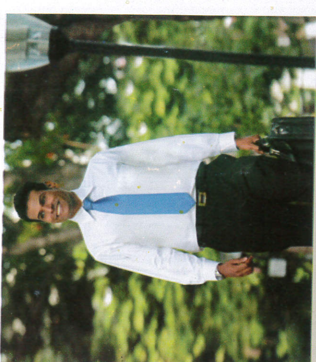
■ மலி மலி மலி மலி Leaving home for work வேலைக்கு செல்லல்