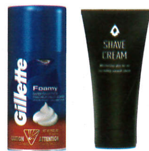
ர஢ுலு வகலீ ஊலேபந Shaving cream - சேவிங் கிறீம்