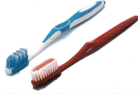
஢ுன் மூர்சூ Tooth brush - பல் தூரிகைகள்