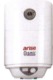
கீவரச Water heater - நீர் சூடாக்கி