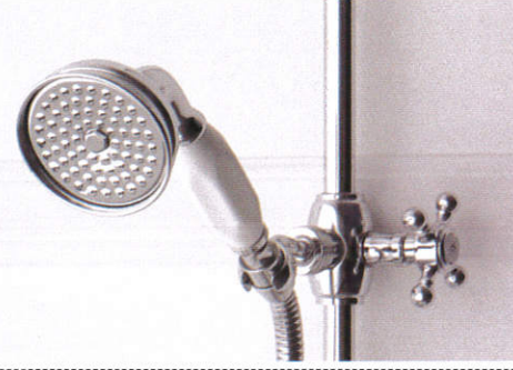
ஊன் வதுர்மல Hand shower - கை குளித்தல்