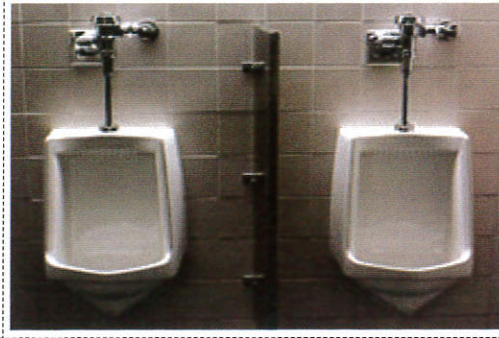
மூவு பாசனய Urinal - சிறுநீர் கழிவறை