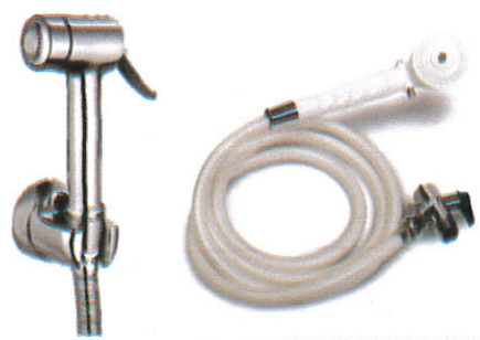
வகிகிடு சல ஓகினய Bidet spray - கழிப்பறை கருவி