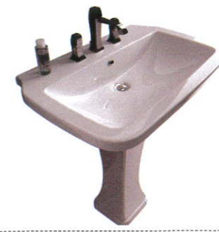
வீசம Sink - பேசன்