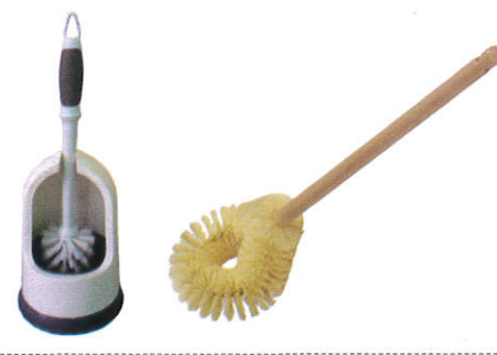
மூர்சூ Toilet brushes - கழிப்பறை தூரிகை