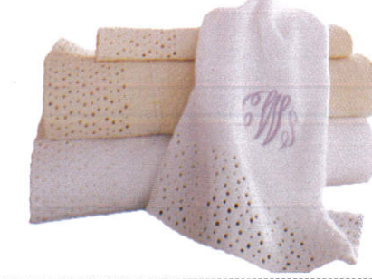
நுலாய Towels - துவாய்