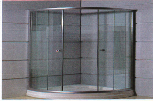
நாந கடுச Shower cubical - குளியலறை