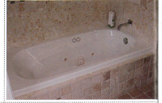
நாந வீசம Bath basin (tub) - குளிக்கை பேசன்