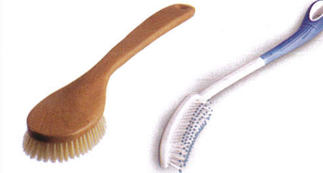
ஊரந ஊநுலுந கலசீக Body brush - உடல்தூரிகை