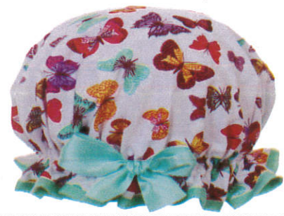
கிசீ வகீம Shower cap - மழை தொப்பி