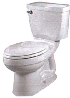
வகிகிடு சேவீவீச Toilet commode - கழிப்பறை கழிவுகலம்