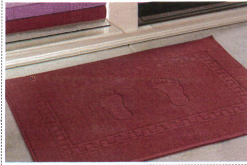
பாடீசீக Carpet - காபட்