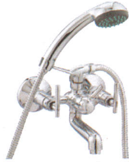
ஓஷுசூவீ வதுர் மல Hot water shower - வெந்நீர் குளித்தல்