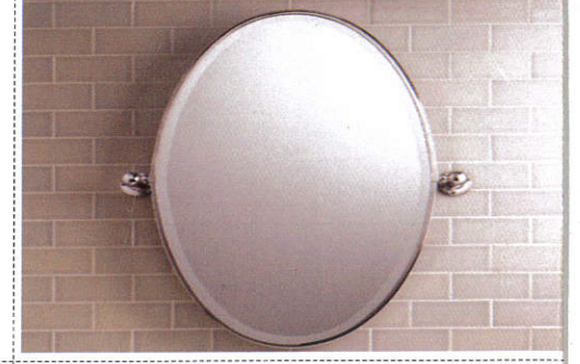
கண்ணாடீய Mirror - கண்ணாடி