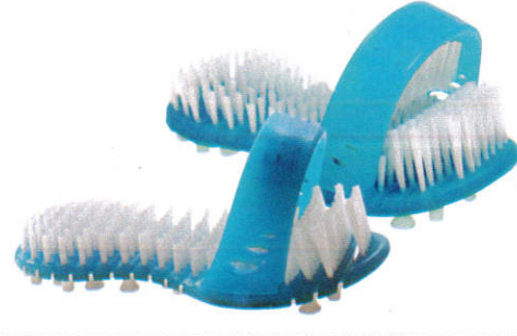
நாந காமர பாவினீ Bathroom slippers - குளியல் செருப்பு