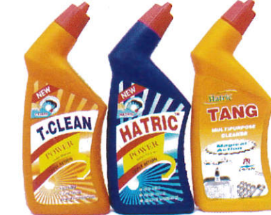
வகிகிடு சீரகீடகாரந Toilet cleaner - கழிப்பறை தூய்மையாக்கி