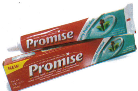
஢ுன் வலனீ Toothpaste - பற்பசை