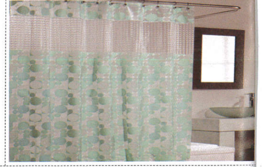
கீரய Shower curtain - குளியலறை திரைச்சீலை