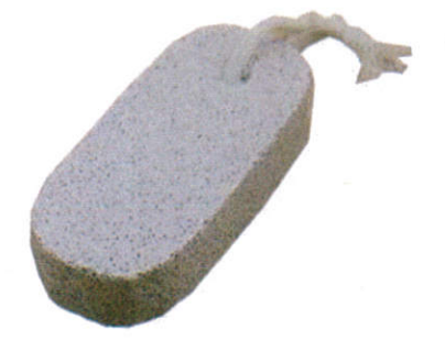
஢ுலா சரகீட கரநய Foot rubbing stone - பாதம் தூய்மய கல்