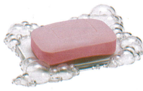
கலன் Soap - சவர்க்காரம்