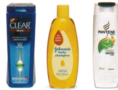
ஊமீசூ Shampoo - சம்பூ