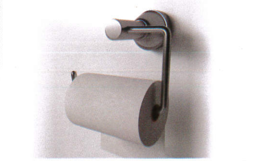
வாடீலடு சேசர் Toilet paper - கழிப்பறை கடதாசி