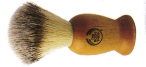
கலன் ஊலேபந மூர்சூவ Shaving brush - சேவிங் தூரிகை