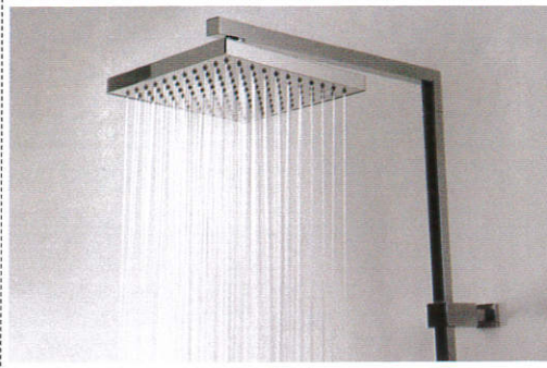
வතුர் மல Shower - மழை பொழிவு