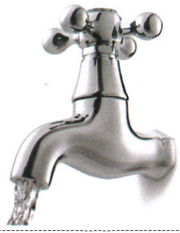
ජල කරාමය Regency tap - தண்ணீர் டப்