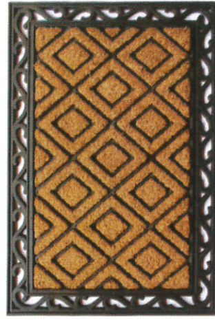
பா பீக்லை - Mat கால் கடைபும்