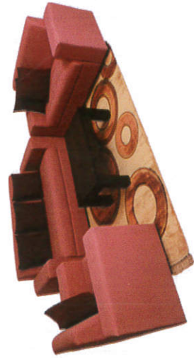
கேர்பி - Sofa Set சொகுசு நாற்காலி