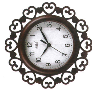
வினாக்கள் - Wall Clock சுவரக்கடிகாரம்