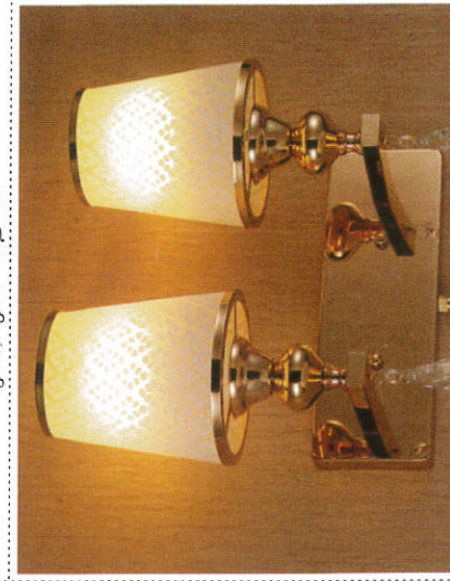
வீன்கி லுத்தி - Wall Lamp Shades சுவர் விளக்கு நிழல்கள்