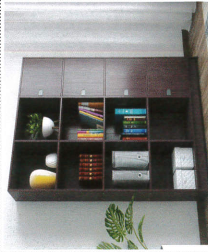
லோன் ராண்டி - Book Shelf புத்தக இறாக்கை