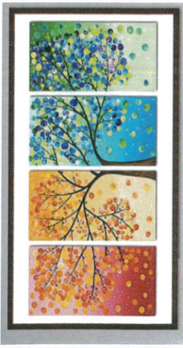
வீண்கி பிளிக்டர் - Wall Picture சுவர்ப் படம்