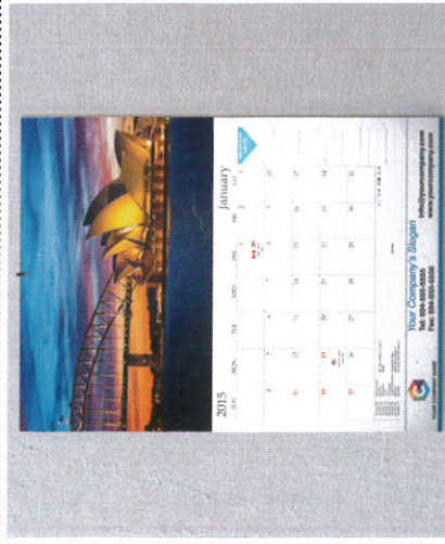
தீப டிஜனல் - Calendar நாட்காட்டி