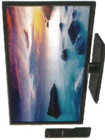
ரஜலாகித்ய - Television (T.V.) தொலைக்காட்சி