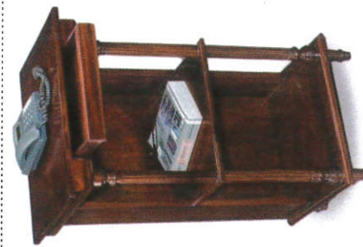
தொலைபேசி அட்டவணை Telephone Table தூர்வாங்கி எழுத்து