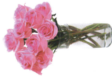
மலர் வளாக - Flower Vase பூச்சாடி