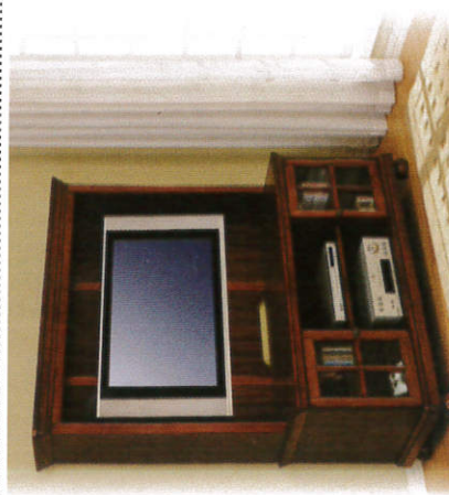
කැබිනෙට්ටුව - Cabinet அலுவலர்