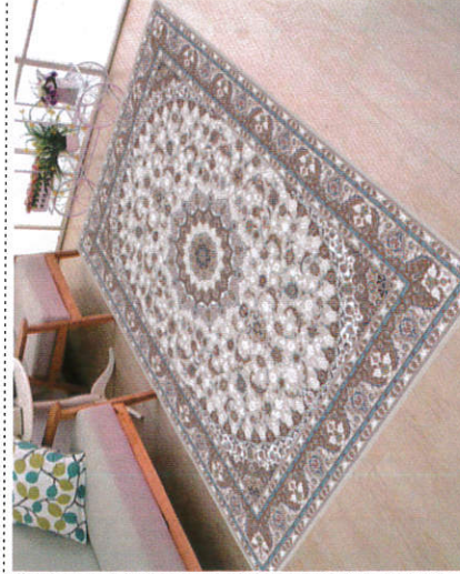
இலக்கு - Carpet தரை விரிப்பு