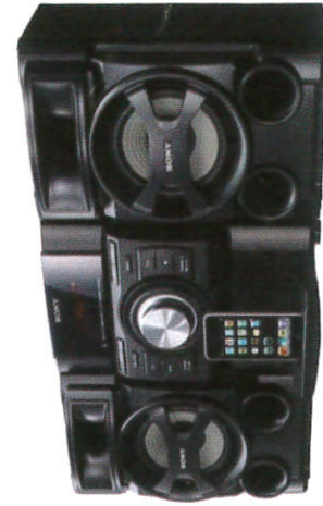
විකියෝ සංගීත පද්ධතිය Video & Music System