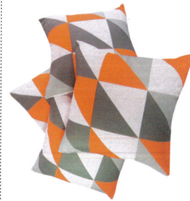
பெயர் - Cushion சொகுசு தலைவயணை