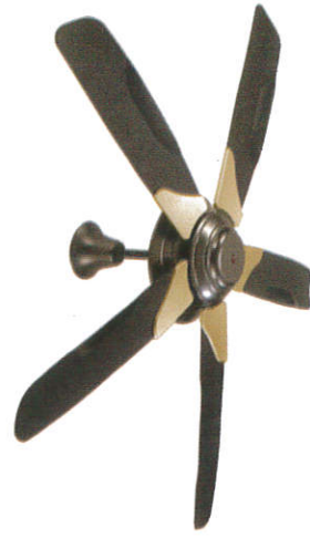
සිව්විං පාංකාල - Ceiling Fan ජ්විලිං මිනිවිසිලි