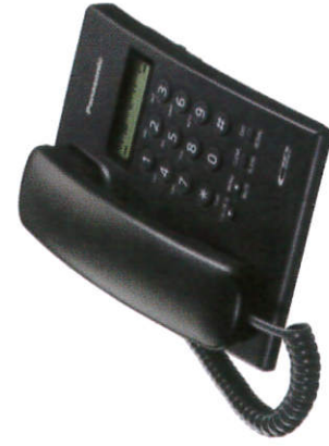
உர்஑ி஑ - Telephone தொஸபேசி