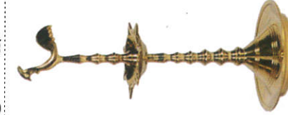
பீர்தல பஹ - Brass Oil Lamp பித்தளை விளக்கு