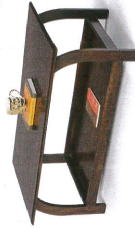
..... வீலை - Center Table மத்திய மேசை