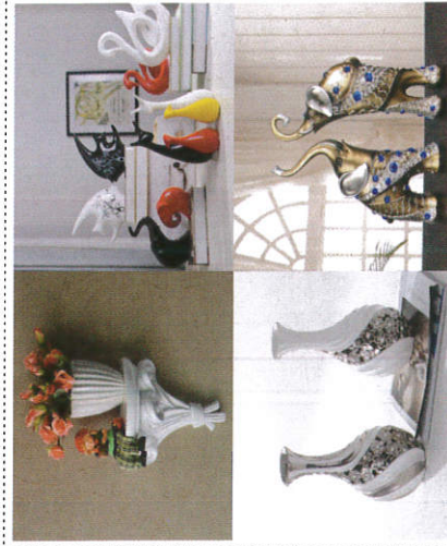
அலங்கார பொருட்கள் - Ornaments