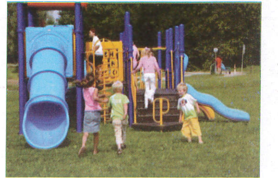
ஸ்கை டைப் - Slippery Tube வழுக்கும் குழாய் (வலிவ்லி டைப்)