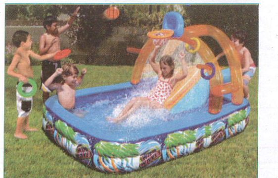
சுவிம் பூல் - Swimming Pool நீச்சல் தடாகம் (சுவிம் பூல்)