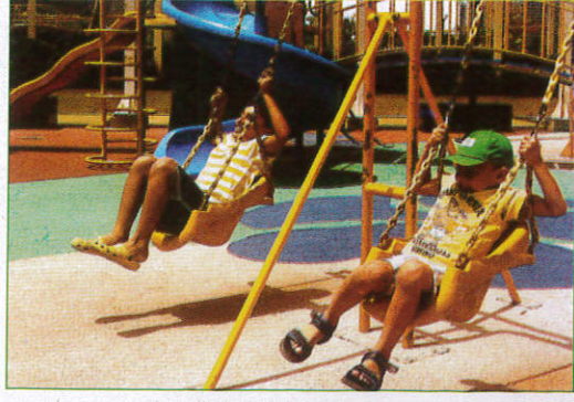
இன்விர்லாவ - Swing ஊஞ்சல் (சூஞ்சல்)