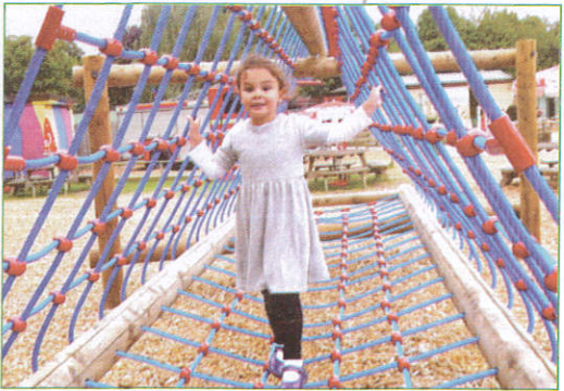
சுய்ஜை பாலம் - Swing bridge ஆடும் பாலம் (சுய்ஜை பாலம்)