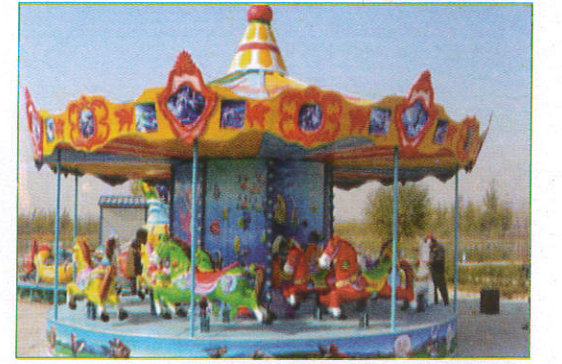
ஹோர்ஸ் ரைடு - Horse swing குதிரையில் ஓடுதல் (கிரைவ் டிரைவ்)