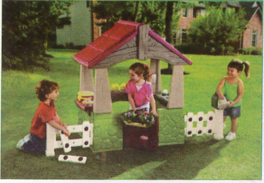
கேர்ட் கிவ் - Playing House விளையாட்டு வீடு (பிளேஹவுஸ்)