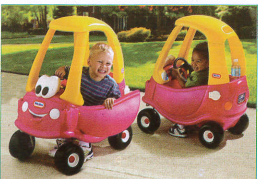
கேர்ட் கைரீலி - Toy Car விளையாட்டு கார் (பிளேஹவுஸ்)