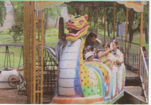
டிரைன் கைரீலி - Dragon Train மகர இரதம் (டிரைன் ஓர்ட்)