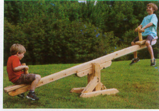
கிசோவ - Seesaw சீசோ (கிசோ)