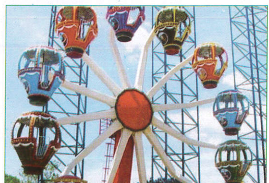
மெரி கோ ரவுண்ட் - Merry go Round சக்கர ஊஞ்சல் (கைரீலி)