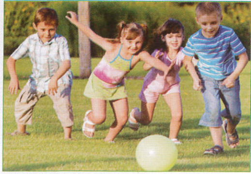
பந்த கேர்ட் - Ball Playing பந்தாட்டம் (பந்தாட்டம்)