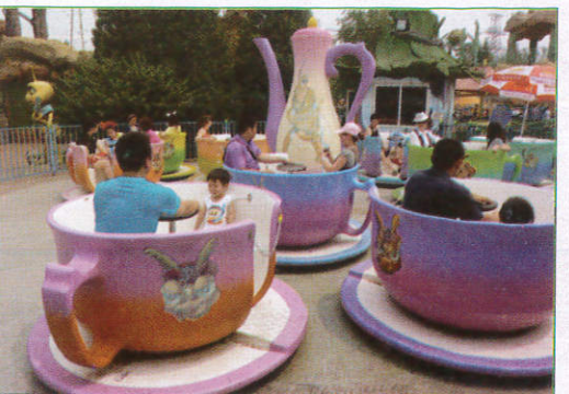
டர்னங் டீ கப் - Turning Tea Cups சுற்றும் தேநீர் கோப்பைகள் (டர்னங் டீ கப்)