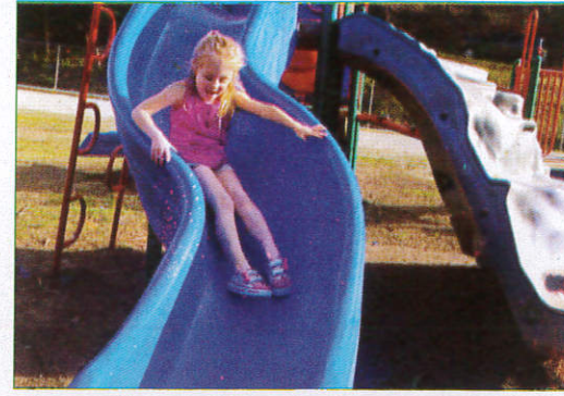
ஸ்கை ஸ்லிப்பி - Slippery Boat வழுக்கும் படகு (வலிவ்லி சலிவு)