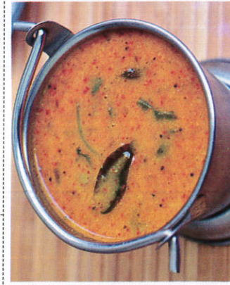
சாம்பார் / Sambhar Curry சாம்பார்