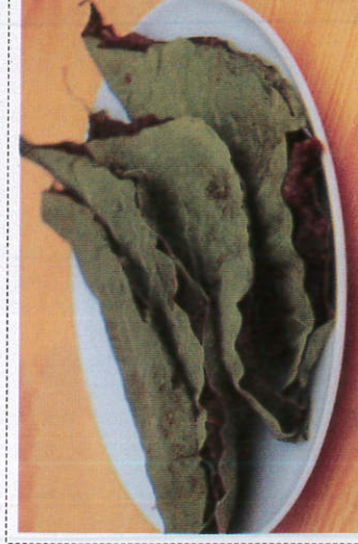
ஹலப்ப / Helapa ஹலப்ப