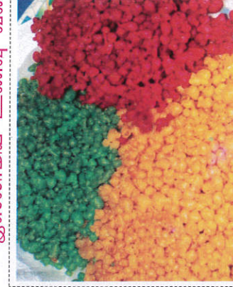
பூந்தி / Boondi பூந்தி