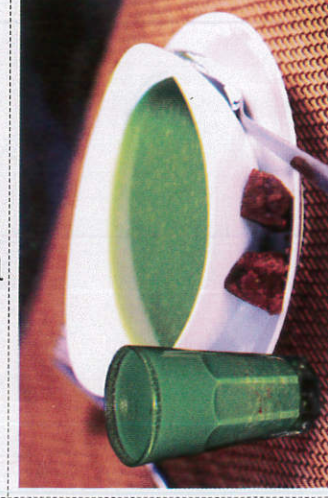
ஹெரல் க்ரூல் / Herbal Gruel ஹெரல் க்ரூல்