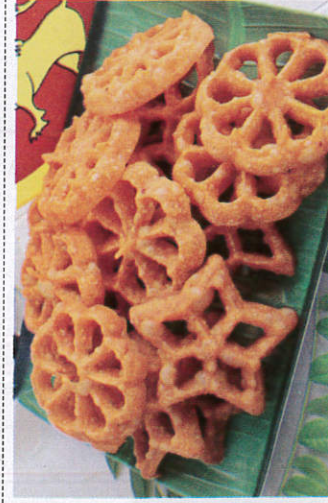
கொகிஸ் / Kokis கொகிஸ்