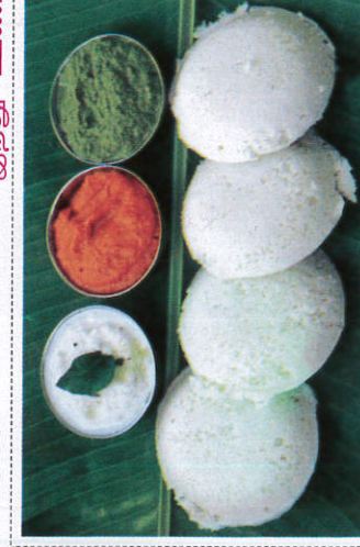
இட்லி / Idli இட்லி