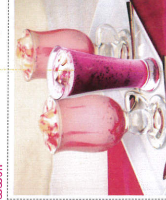
புலூடா / Falooda புலூடா