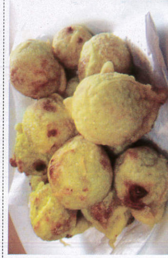
மங்குலி / Munguli மங்குலி