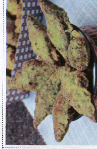
மம் கெவம் / Mum Kevum மம் கெவம்