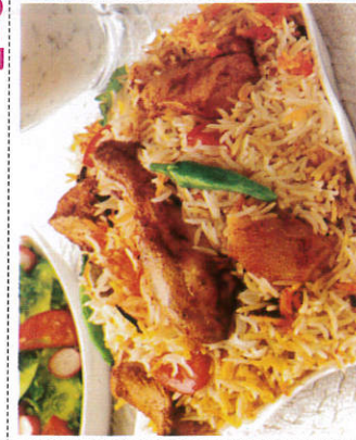
பிரியானி / Biryani பிரியானி