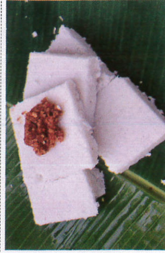
மில்க் ரைஸ் / Milk Rice பாற்சோறு