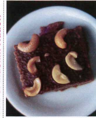
வட்டிப்பம் / Watalappan வட்டிப்பம்