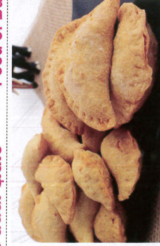
பெட்டிஸ் / Patties பெட்டிஸ்