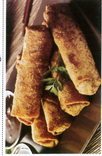
ரோல்ஸ் / Rolls ரோல்ஸ்