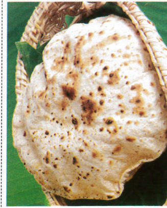
சபாத்தி / Chapati சபாத்தி