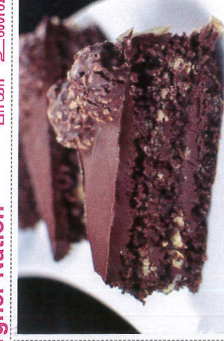
கேக் / Cake கேக்