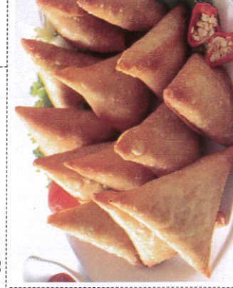
சமோசா / Samosa சமோசா