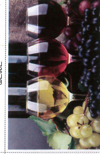
வைன் / Wine வைன்