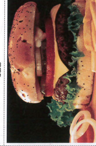
பேர்கர் / Burger பேர்கர்