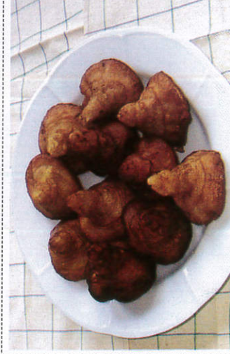
கொண்டா கெவம் / Konda Kavum கொண்டா கெவம்