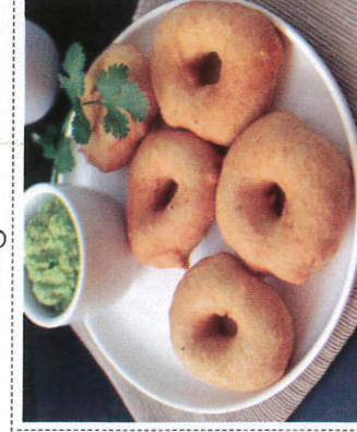
மசால வடை / Masala Vadai மசால வடை