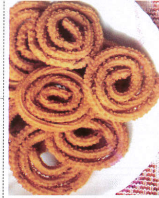
முறுக்கு / Murukku முறுக்கு