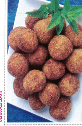
கட்லெட் / Cutlets கட்லெட்