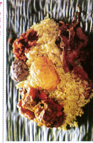
லம்பு ரைஸ் / Lump Rice லம்பு ரைஸ்