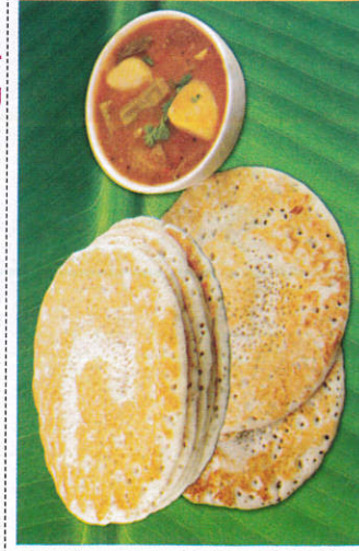
தோசை / Thosai தோசை