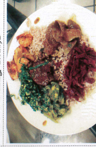
ரைஸ் / Rice ரைஸ்