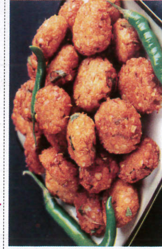
தால் வடை / Dhal Vadai தால் வடை