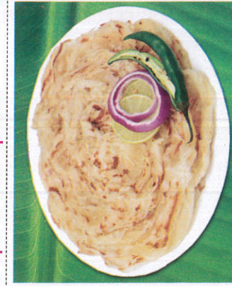
பராட்டா / Paratha பராட்டா