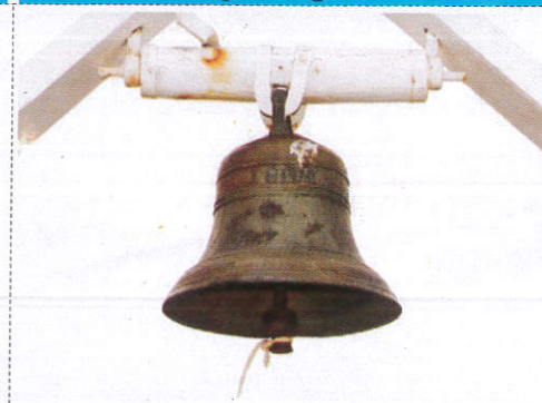
ගන්ධාරය Bell මනි