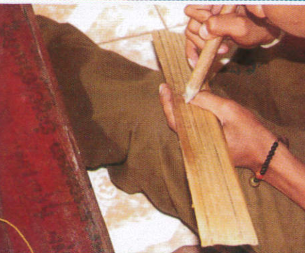
තල් කොළවල ලිවීම Writing on Palmyra Leaf පොලොවල ලිවීම