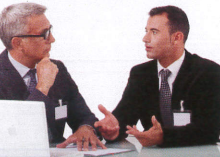
සංවාදය Conversation දොලාස්පාලය