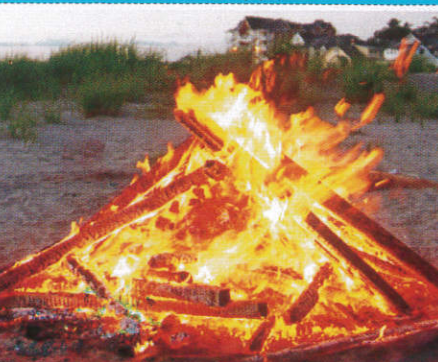
ගිනිමැල ගැසීම Bonfires දොලාස්පාලය