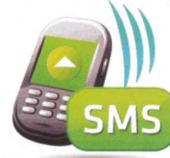
කෙටි පණිවිඩ SMS කිරිය සෙට්ටි