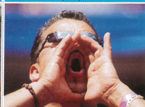
හු කීම Booing ඉලි දොලාස්පාලය