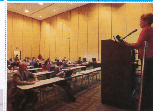
සම්මන්ත්‍රණය Conference දොලාස්පාලය