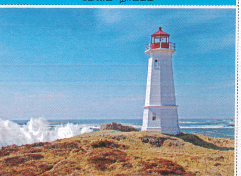
ප්‍රදීපාගාරය Light House කලාස්කරා වලාස්කම