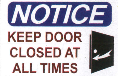
දැන්වීම Notice අඟිවිට්ටු