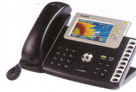
දුරකථනය Telephone දොලාස්පෙට්ටි