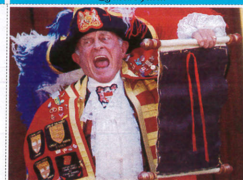
ආරංචි පතුරුවන්නා Crier පතුරාපතුරා