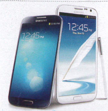
සංඛ්‍යා දුරකථනය Mobile Phone කையයුග්ගයේ