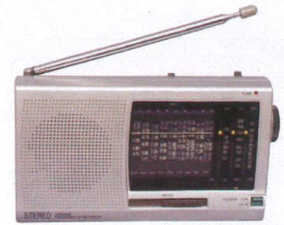
බුන්ඩ් විද්‍යුතිය Radio වාගොලා