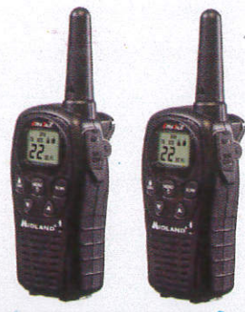
වොක් ටෝක් දුරකථනය Walkie Talkie වාක්කිටාක්කි