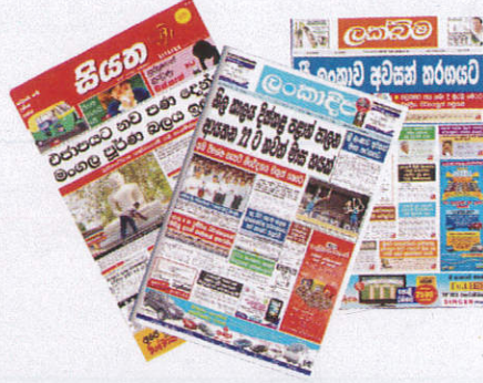
පුවත් පත් News Papers දොලාස්පත්තුව