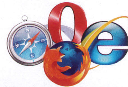
අන්තර්ජාලය Internet දොලාස්පාලය