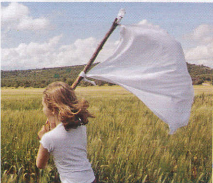
කොඩිය Flag කොඩි