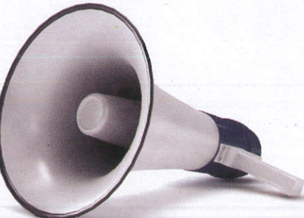
බවිලි විකාශන යන්ත්‍රය Loud Speaker ඉලිට්ටෙරුක්කි