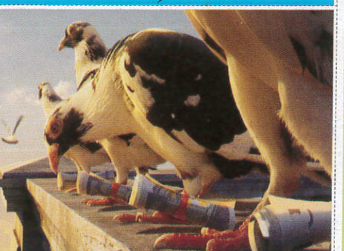
කුරුල්ලන් Birds පතුරාපතුරා