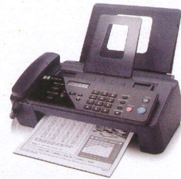
ෆැක්ස් යන්ත්‍රය Fax Machine දොලාස් බැඳුණු