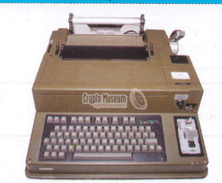
ටෙලික්ස් යන්ත්‍රය Telex Machine අස්සු දොලාස්පාලය