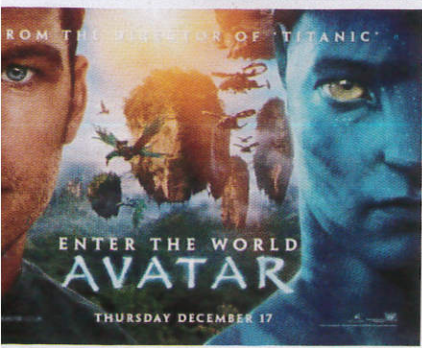
පෝස්ටර් Poster කවාරාට්ටු