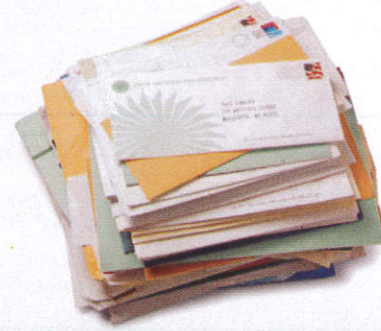
ලිපි මේල Mail කඩුල්ල