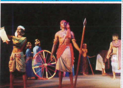
වේදිකා නාට්‍ය Stage Drama මොදාස් නාට්‍ය