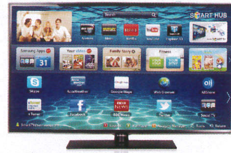
රූපවාහිනිය Television දොලාස් කාට්ටි