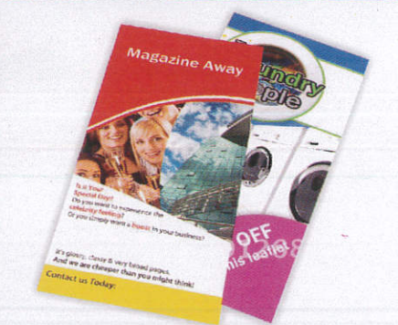
අත් පත්‍රිකා Hand Bills කෙවිලාස්පත්‍ර