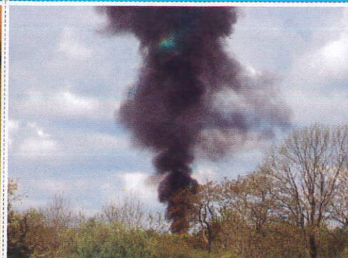
දුම් ගැසීම Fumigation පුකොලාස්පාලය