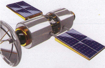
චන්ද්‍රිකාව Satellite දොලාස්කොල්