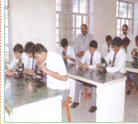
விடூனாலய - Science Lab விஞ்ஞான ஆய்வுகூடம் (விடூனாலய அடிவரகூடம்)