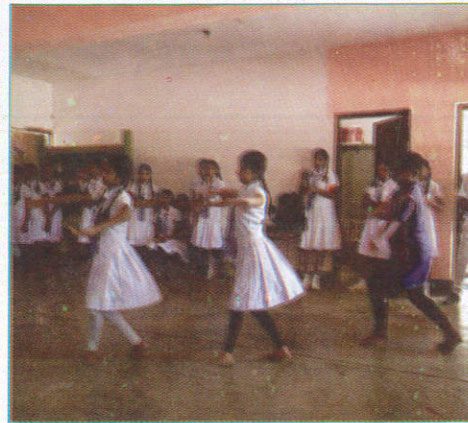
தூரூபி காலம் Dancing Room நடன அறை (தூரூபி அறை)