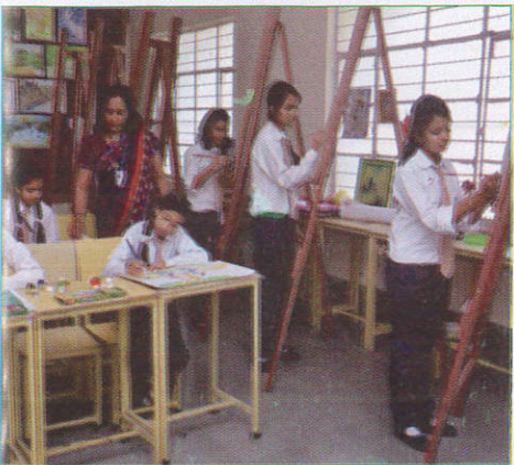
கலா தூர் Art Room சித்திர அறை (கித்திர அறை)