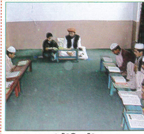
மூசுலிம் சலீலே Mosque பள்ளி வாசல் (சலீலே வாசல்)