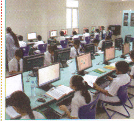
சரிதூக காலம் Computer Room கணினி அறை (கணினி அறை)