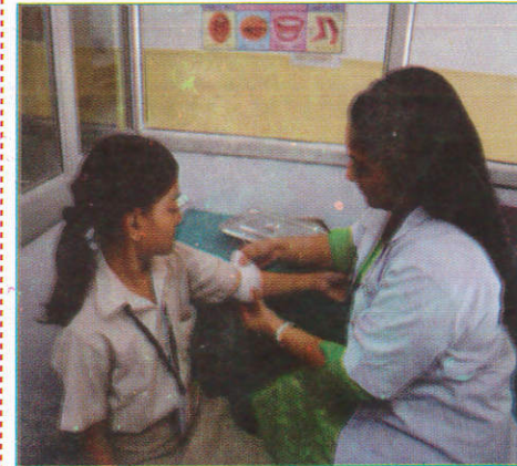
பூரூபிதூர் காலம் First Aid Room முதலுதவி அறை (முதலுதவி அறை)