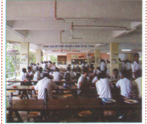
அதூக தூரூபி Canteen உணவகம் (அதூகம்)