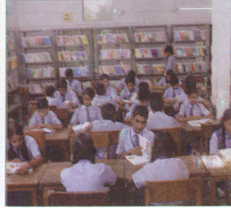
புத்தகாலய Library நூலகம் (புத்தகம்)