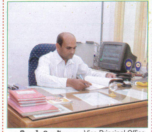
உச விடூனல்சுகி காரியாலய - Vice Principal Office துணை அதிபர் காரியாலயம் (துணை அடிவர காரியாலயம்)