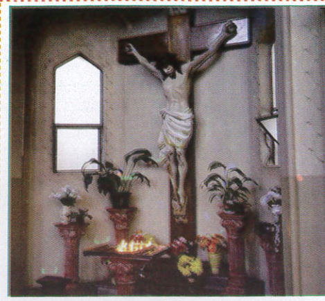
சுலீலே Church கிறிஸ்தவ தேவாலயம் (கூகிவலி டேவாலயம்)