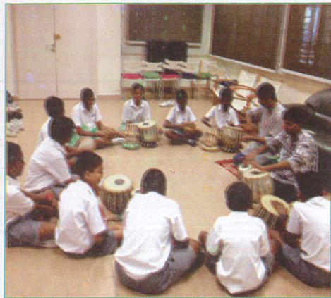
கூகி காலம் Music Room சங்கீத அறை (கூகி அறை)