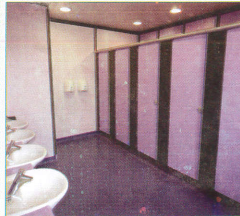
விடூகிதூர் Wash Room கழிவறை (கழிவறை)