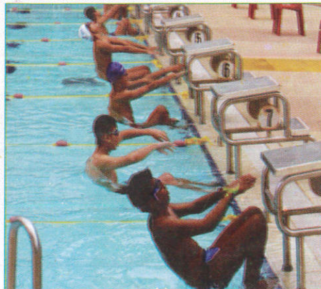
கித்தூபி தூரூபி Swimming Pool நீச்சல் தடாகம் (கித்தூபி தடாகம்)