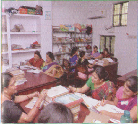
தூர் விவேகாலய Staff Room ஆசிரியர் அறை (அசிரியர் அறை)