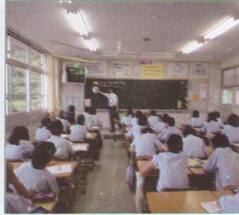
சங்கி காலம் Class Room வகுப்பறை (வகுப்பறை)