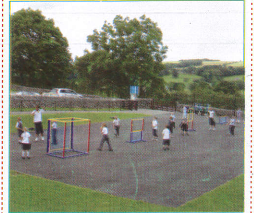
கூரி கித்தூபி - Play Ground விளையாட்டு மைதானம் (விளையாட்டு மைதானம்)