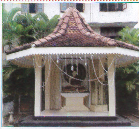
இட மூடூர் Budu Madura விகாரை (வினாடேரி)