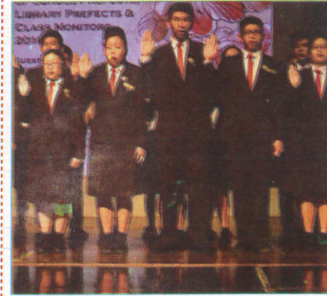
கூகிதூர் காலம் - Prefect Room மாணவத்தலைவர் அறை (மாணவத்தலைவர் அறை)