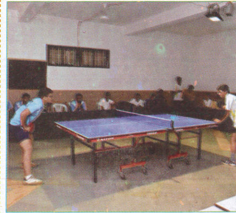
கூரிதூர் Sports Room விளையாட்டறை (விளையாட்டறை)