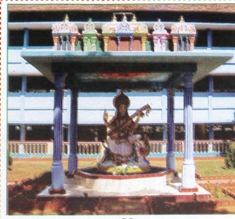
கோவிலு Kovil கோயில் (கோவிலு)