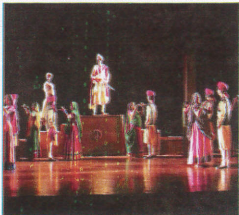
விடூகால Drama Stage மேடை (மேடை)