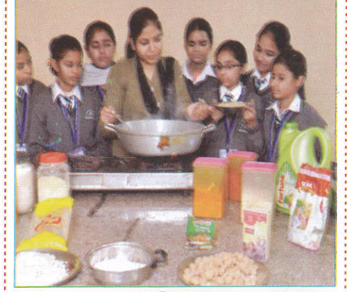
தூக விடூனாலய Home Science Room மணையியலறை (மணையியலறை)