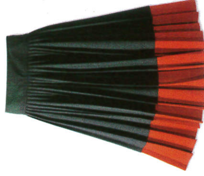
භාය Skirt பாவாடை