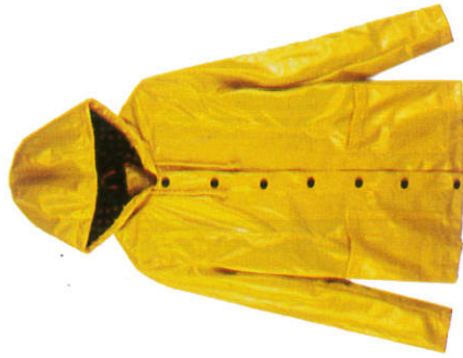
ලකි කමාය Raincoat மழைக்கோட்