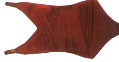
නාන ඇඳුම Swim Wear நீச்சலுடை

"Sometimes the heart sees what is invisible to the eye" | "සමහර විට ඇසට නොපෙනෙන දේ හදවත දකී"