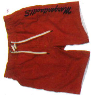
කොට කලියම Short Trouser சிறிய பேண்ட்