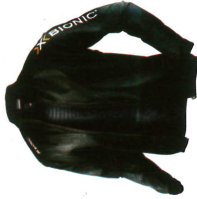
ජැකට්ටු Jacket ஜெக்கட்