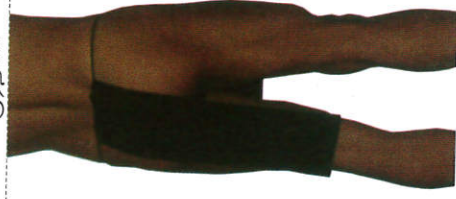
අමුමය Loincloth கோமணம்