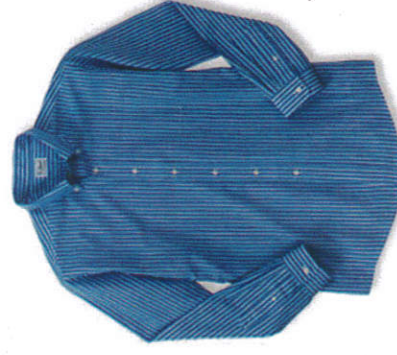
කමිසය Shirt சட்டை