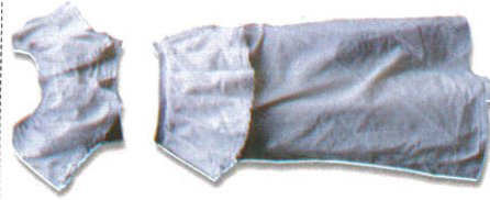
ලමා භාරිය Half Saree சிறிய சேலை