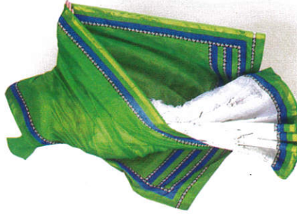
භාරිය Saree சேலை