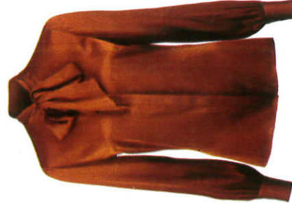
භැටිය Blouse பென்மேலாடை