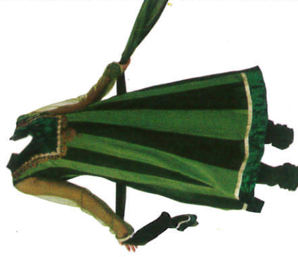
සල්වාරය Salwar Kameez சலவார்