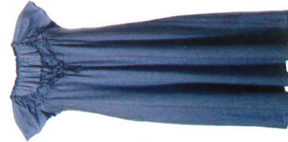
නිදන ඇඳුම Night Dress இரவில் ஆடை