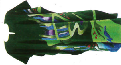
කර්තන් ඇඳුම Kaftan Dress கப்தான்