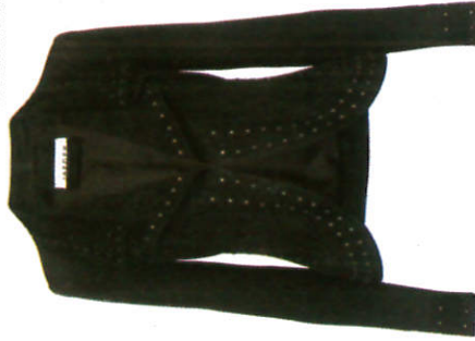
ජැකට්ටු Jacket ஜெக்கட்