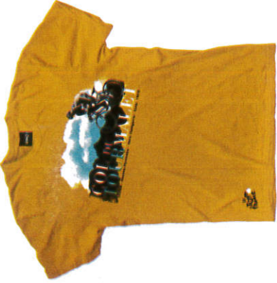
ටී ෂර්ට් T-Shirt டிசட்டை