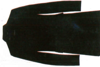
උඩුකමාය Coat மேல்கோட்