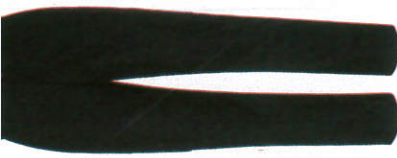
කලියම Trousers கல்கன்

"Sometimes the heart sees what is invisible to the eye" | "සමහර විට ඇසට නොපෙනෙන දේ හදවත දකී"