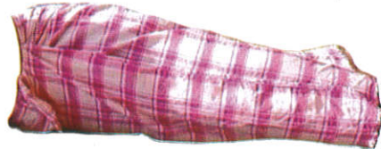
චිත්තිය Cloth சித்தைப்படைவை