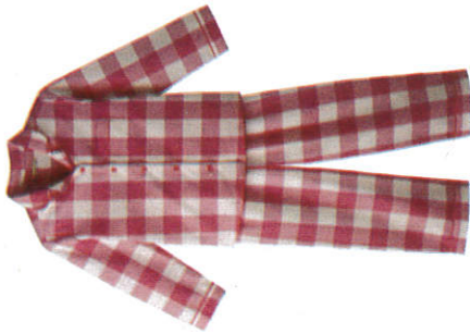
පිචාමා Pyjama பைஜாமா