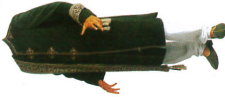
කුර්තා Kurtha குர்தாவ