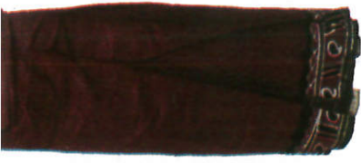
සරම Sarong சாரம்