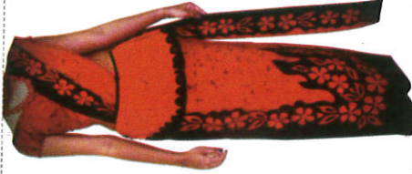
කෙරිය Kandyan Saree கன்றி சேலை