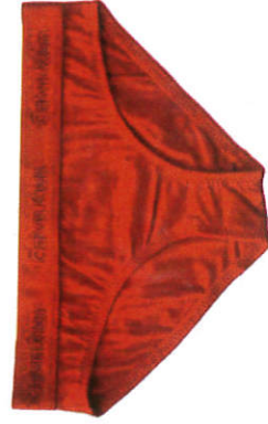
යට ඇඳුම Under Wear உள்ளடை