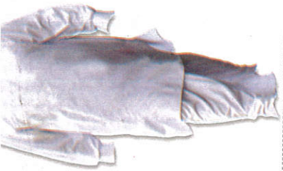
ජාතික ඇඳුම National Dress தேசிய ஆடை