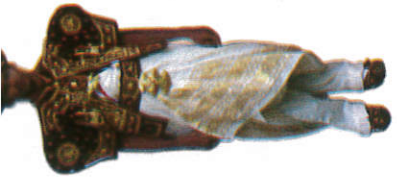
උඩරට මල් ඇඳුම Kandyan Wedding Dress கனடியன் திருமண உடம்பு