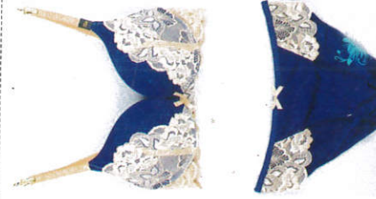
බ්‍රසර්සට් සහ යට ඇඳුම Brassier & Panty ப்ரெசியරும் ஜட்டியும்