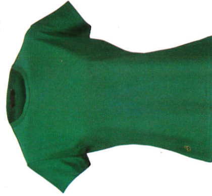
ටී කමිසය T-Shirt சட்டை