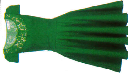
ගවුම Frock கவுன்